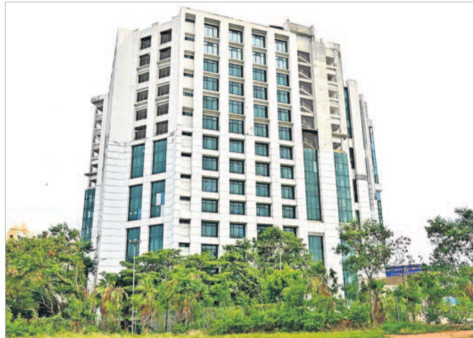
1261 బసీయా బెడ్లు.. వేలాది మందికి సేవలు

హైదరాబాద్, నవంబర్ 3 (నమస్తే తెలంగాణ): కరోనా కష్టకాలంలో వేలాది మంది రోగులకు సేవలందించిన గవ్వబోలిలోని టీమ్ (తెలంగాణ ఇన్స్టిట్యూట్ ఆఫ్ మెడికల్ సైన్సెస్ అండ్ రిసెర్చ్) ఇక కనుమరుగు కానున్నది. ఈ భవనాన్ని సాఫ్ట్ విలేజ్ మాస్ట్రాలని కాంగ్రెస్ ప్రభుత్వం నిర్ణయించింది. దవాఖాన భవనాలు, స్థలాలను యాత్ర అధికారులు వెంటదింపి కలెక్టర్ డిపార్ట్మెంట్కు బదిలీ చేయనున్నది. ఈ మేరకు శనివారం ఉత్తర్వులు జారీ చేసింది. టీమ్ ను వైద్యులకారులు సాఫ్ట్ విలేజ్లోనే ఉంచాలి (శాఖ) కు అప్పగించాలని ఉత్తర్వులు సూచించింది. జాతీయ, అంతర్జాతీయ స్థాయి అధ్యాపకులతో కూడిన శిబిరాలు నిర్వహించే పేర్కొన్నది.