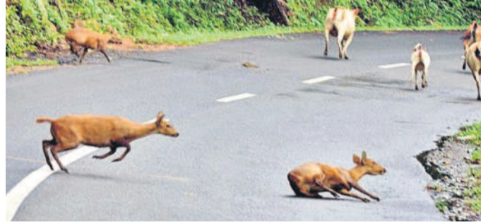
డీకొని అక్కడిక్కడే మరణిస్తున్నాయి.