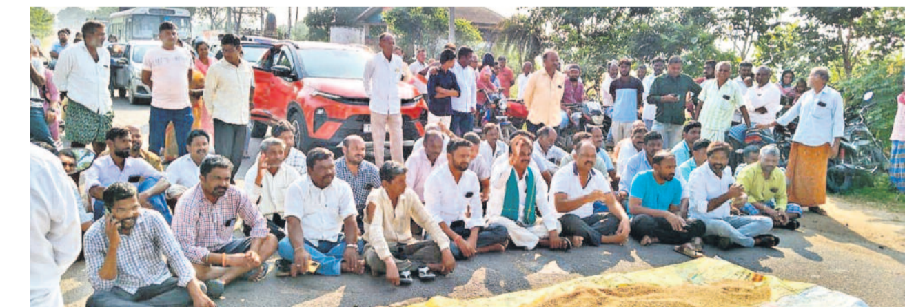
రాజన్న సిరిసిల్లా జిల్లా ఎల్లారెడ్డిపేట మండలం బదిర వద్ద కామారెడ్డి-కరీంనగర్ రహదారిపై ధాన్యం పోసి నిరసన తెలుపుతున్న రైతులు

కోడండరాను నిలదీసిన పార్ సమాజం 'మాట-ముచ్చట'లో కాంగ్రెస్ గ్యారంటీలపై చర్చ ఎగవేతల సర్కార్ పై ఎందుకు పోరాడటానికి ప్రశ్నల వర్షం వినకపోతే సర్కార్ గల్లాపట్టి అడిగే హక్కు ఉన్నదన్న కోడండరాం > 2