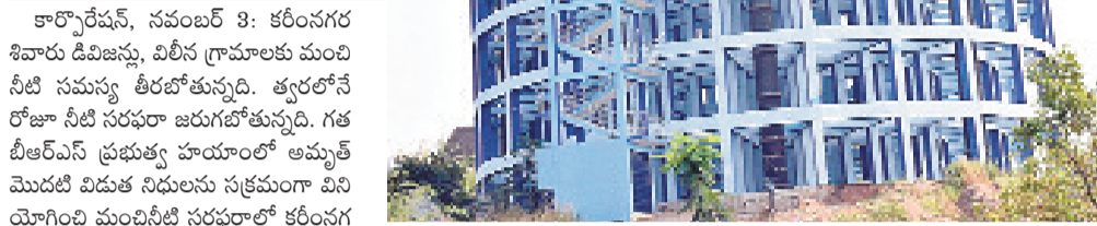
రోజూ మంచినీటి సరఫరా చేస్తున్నారని మొదటి విడుదల వచ్చిన నిధులను సక్రమంగా వినియోగించి దేశంలో రోజూ మంచినీటి సరఫరా చేస్తున్న నగరపాలక సంస్థ

కార్యారంభం, నవంబర్ 3: కరీంనగర్ శివారు డివిజన్లకు, వీటిని గ్రామాలకు మంచి నీటి సమస్య తీరబోతున్నది. త్వరలోనే రోజూ నీటి సరఫరా జరుగబోతున్నది. గత టీఆర్ఎస్ ప్రభుత్వ హయాంలో అమ్మత్-2 మొదటి విడుదల నిధులను సక్రమంగా వినియోగించి మంచినీటి సరఫరాలో కరీంనగర్ రాష్ట్ర డివిజన్లకు నిధులను అమ్మత్-2కు నగరపాలక సంస్థ ఎంపికైంది. నిధులు కూడా అదే సమయంలో మంజూరు కాగా, శివారు ప్రాంతాల్లో వచ్చే 90 ఎండ్లకు అనుగుణంగా అవసరమైన పనులకు యంత్రాంగం ప్రణాళికలు వేసింది. సోమవారం ఉదయం కేంద్ర హోం శాఖ సహాయ మంత్రి బండే సంజయ్, మాజీ మంత్రి గంగుల కమలాకర్, మేయర్ సునీల్ రావు పనులకు శ్రీకారం చుట్టినందుగా, ప్రజానీకం సంబరపడుతున్నది.