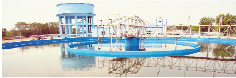
నగరంలో మంచినీటి సరఫరా చేసే ఫిల్టర్ బెడ్

తెలంగాణవ్యాప్తంగా, నవంబర్ 3: మూలలు ఐక్యత చాటాలి, మూల-మూల ఉపకులాలకు ఎలాంటి అన్యాయం జరుగుతున్నా ముందుండి పోరాడతామని చెన్నూర్ ఎమ్మెల్యే వివేక్ వెంకటస్వామి హామీ ఇచ్చారు. నగరంలోని పద్మావతి పునరాధారణ కార్యక్రమంలో ఆదివారం నిర్వహించిన మూల-మూల ఉపకులాల ఐక్యత అభివృద్ధి సమావేశానికి శాసన ముఖ్యఅతిథిగా వచ్చి మాట్లాడారు. మూల మీద జరుగుతున్న దుర్మూలాలను తిప్పికొట్టాలన్నారు. గ్రామ గ్రామాన మూల కమిటీలు వేసి వైతన్య పరచాలని సంఘం నాయకులకు సూచించారు. రాజకీయాలకు