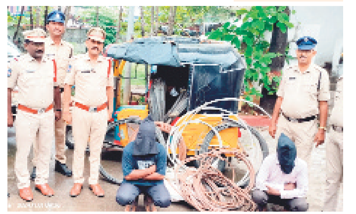
పట్టుబడిన దొంగలను చూపేందుకు పోలీసులు (ఫైల్)