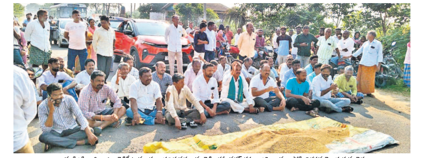
రాజన్న సిరిసిల్ల జిల్లా ఎల్లారెడ్డిపేట మండలం పదిర వద్ద కామారెడ్డి-కరీంనగర్ రహదారిపై ధాన్యం పోసి నిరసన తెలుపుతున్న రైతులు

కోదండరాంను నిలదీసిన పౌర సమాజం 'మాట-ముచ్చట'లో కాంగ్రెస్ గ్యారంటీపై చర్చ ఎగవేతల సర్కార్ పై ఎందుకు పోరాడట్టదని ప్రశ్నల వర్షం వినకపోతే సర్కార్ గల్లాపట్టి అడిగే హక్కు ఉన్నదన్న కోదండరాం >2