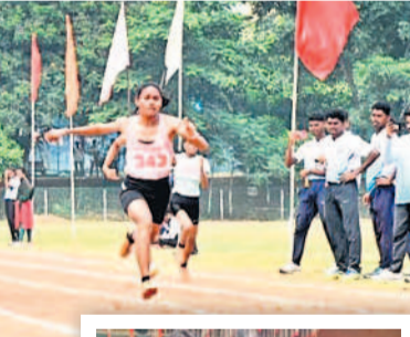
పదమంజులలో పోటీ పడుతున్న మహిళా క్రీడాకారులు

డిపార్టుమెంట్ సీఎంఆర్ ఇచ్చే ప్రస్థావన ప్రకారం తెలిపింది. వానకాలం దాన్యం కేటాయింపు విషయమై పలు నిబంధనలతో ప్రభుత్వం తీసుకొచ్చిన జీవో 27 కొత్త చిక్కులు తెచ్చింది. మిల్లర్లు బ్యాంకు గ్యారంటీ లేదా సెక్యూరిటీ డిమాండ్ చిల్లెంచాలని, డిడ్డు రకం దాన్యం కింగ్సటా రూ. 30, సన్నా లకు రూ. 40 చొప్పున మిల్లింగ్ ఛార్జీలు చెల్లిస్తామని, అది కూడా గడువుల్లో పూర్తి చేస్తేనే అది అందదో స్పష్టం చేసింది. జిల్లాలో 45 రాజైస్, 21 పారా బాయిల్డ్ మిల్లులుండగా, అందులో 6 రాజైస్, ఒక పారా బాయిల్డ్ మిల్లు డిపార్టుమెంట్ జాబితాలో ఉన్నాయి. జిల్లాలో 3,48,068 ఎకరాల్లో రైతులు వరి సాగు చేయగా, 2,67,178 మెట్రిక్ టన్నుల దొడ్డు రకం, 110 లక్షల మెట్రిక్ టన్నుల సస్య దాన్యం సేకరణ లక్ష్యంగా 180 కొనుగోలు కేంద్రాలు ఏర్పాటు చేశారు. అయితే సస్య దొడ్డు రకం కలిపి 3.77 లక్షల మెట్రిక్ టన్నుల దాన్యం సేకరణ లక్ష్యానికి ఇప్పటి వరకు కేవలం 561 మెట్రిక్ టన్నులే కొనుగోలు చేశారు.