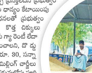
జనగామ వ్యవసాయ మార్కెట్లో ఇక్కడ కొనుగోలు కోసం ఎదురుచూస్తున్న రైతులు

రోజులు దాటుతున్నా ఇవాళ, రేపు అంటూ అధికారులు బాటమ్మన్నారు. అకాల వర్షానికి ఇప్పటికే పలు మాట్లాడుతూ తడిసి ముద్దయ్యిందని రైతులు వాపోతున్నారు. కాగా, గతంలో కృష్ణం మిల్లింగ్ రైస్ (సీఎంఆర్) డెలివరీ చేయక బ్లాక్ లిస్టులో ఉన్న మిల్లర్లకు బ్యాంకు గ్యారంటీ అందుతుంది.