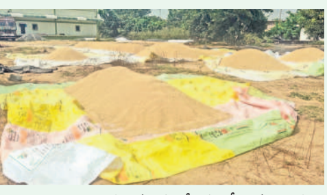
ఎల్మత్తర్రి మండల కేంద్రంలో దాన్యం రాజులు

బీమచేరపల్లి, ధర్మసాగర్, ఇన్ వోలు, హనువపల్లి, వేలేరు మండలాల్లో వరి కోతలు జరుగుతున్నాయి. దాన్యాన్ని రైతులు కొనుగోలు కేంద్రాల్లోనే ఆరబోసుకోగా, నిల్వ చేసుకోవడం వల్ల కారణం. అయితే సెంటర్లు ప్రారంభించి 20 రోజులైనా ఇప్పటి వరకు కింగ్సటా దాన్యం కూడా కాంటా జరగలేదంటే పరిస్థితి ఎలా ఉందో అర్థం చేసుకోవచ్చు. ఈ విషయమై నిరాశాకూలను అడిగితే తమకేం తెలియదనే సమాధానం వస్తున్నదని అన్నదాతలు వాపోతున్నారు. సస్య బియ్యానికి బోనస్ నుంచి