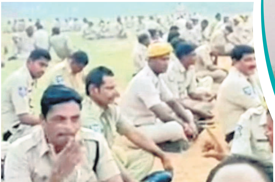
మాజీ హోంగార్లు నిర్బంధం