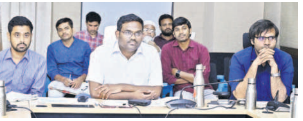
వీసీలో పాల్గొన్న నిజామాబాద్ కలెక్టర్, అడనపు కలెక్టర్, అధికారులు