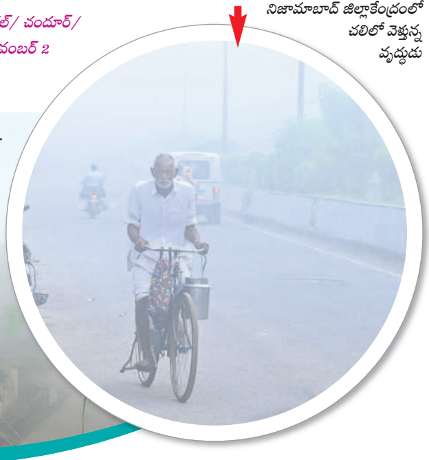
నిజామాబాద్ జిల్లా కేంద్రంలో చలిలో వెళ్తున్న ప్లద్యుడు