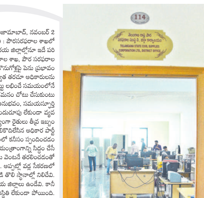
నిజామాబాద్, నవంబర్ 2 (నమస్తే తెలంగాణ ప్రతినిధి) : పౌరసరఫరాల శాఖలో తీవ్ర గందరగోళం నెలకొన్నది. ఉభయ జిల్లాల్లోనూ ఇదే పరిస్థితి కొనసాగుతున్నది. పౌర సరఫరాల శాఖ, పౌర సరఫరాల సంస్థలో నెలకొన్న అయోమయం ధాన్యం కొనుగోళ్లపై పెను ప్రభావం చూపుతున్నది. కాంగ్రెస్ అధికారం చేపట్టిన తర్వాత తరచూ అధికారులను బదిలీ చేస్తుండడం, కొత్త అధికారులకు జిల్లాపై పట్టు లభించే సమయంలోనే బదిలీ అవుతుండడంతో ధాన్యం సేకరణలో మందగమనం చోటు చేసుకుంటున్నది. కీలకమైన వడ్ల కొనుగోళ్లలో అధికారుల అనుభవం, సమయస్ఫూర్తి ప్రధాన పాత్ర పోషిస్తుంది. కానీ, రేవంత్ సర్కారు ముందుచూపు లేకుండా వ్యవహారిస్తూ, ఇష్టానుసారంగా ధాన్యం సేకరణలో వ్యవస్థాపన చేస్తుంటే ప్రజలు పడుతున్నాడు. అన్నదాతల సంక్షేమాన్ని గాలికొదిలేసిన అధికార పార్టీ నేతలు.. ఉమ్మడి జిల్లాల్లో కల్లాలు దాటని వడ్ల విషయంలో కనీసం స్పందించడం లేదు. కేసీఆర్ హయాంలో పంట కోతల సమయాలే యంత్రాంగాన్ని సిద్ధం చేసేవారు. వచ్చిన పంటను వచ్చినట్లు కొనుగోలు చేసి వెంట వెంటనే తరలింపడంతో పాటు వేగంగా రైతుల ఖాతాల్లో డబ్బులు జమ చేసేవారు. అప్పట్లో వడ్ల సేకరణలో రాష్ట్రంలో కామారెడ్డి, నిజామాబాద్ జిల్లాలు పోటీ పడి తొలి స్థానంలో నిలిచేవి. ఒకానొక దశలో ధాన్యం సేకరణలో టాప్ 1లో ఉభయ జిల్లాలు ఉండేవి. కానీ ఇప్పుడు పరిస్థితి లేకుండా పోయింది.