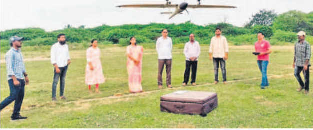
డ్రోన్ సర్వేను పరిశీలిస్తున్న మున్సిపల్ చైర్మన్ సర్వే, కమిషనర్ విక్రంసింహారెడ్డి