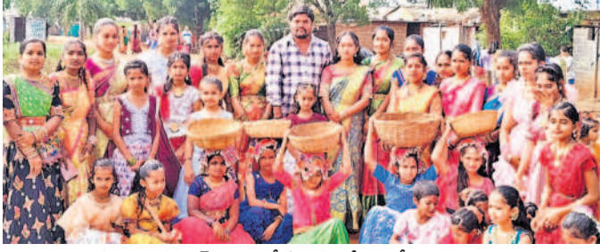
మర్నాటి: పట్టణ తండాలో దీపావళి వేడుకలో తండా వాసులు