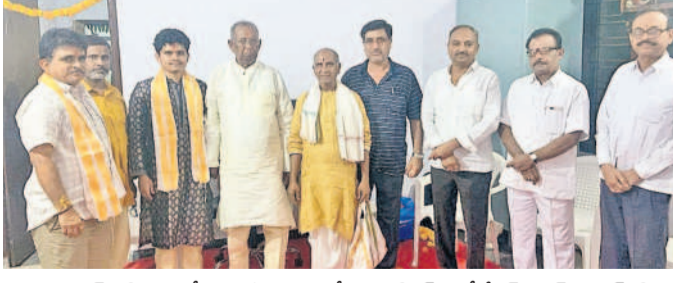
కొడంగల్: లక్ష్మీపూజలో పాల్గొన్న రాష్ట్ర పోలీస్ హౌసింగ్ కార్యదేష్ నైట్స్ గుర్తాడరెడ్డి