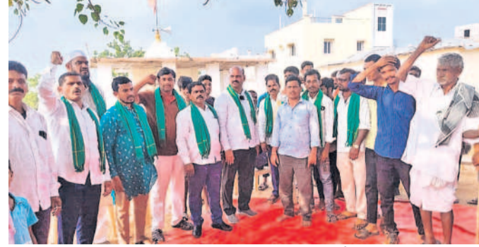
ఫార్మా భూ బాధిత రైతులతో మాట్లాడుతున్న ఎలీమెంటరీ నాయకులు

కొడంగల్, నవంబర్ 1: ఫార్మా కంపెనీల వేరుతీవే రైతుల భూములు లాక్సోదమాని ప్రభు త్వం ప్రయత్నిస్తున్నదని, దీన్ని వెంటనే విరమించుకోవాలని ఎలీమెంటరీ జాతీయ అధ్యక్షుడు దాని రాంనాయక్ డిమాండ్ చేశారు.