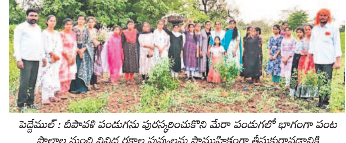
పెద్దముల్త: దీపావళి పండుగను పురస్కరించుకొని మేరా పండుగలో భాగంగా పంట పొలాల నుంచి వివిధ రకాల పువ్వులను సామూహికంగా తీసుకురావడానికి అటవీప్రాంతానికి వచ్చిన గిరిజన యువకులు