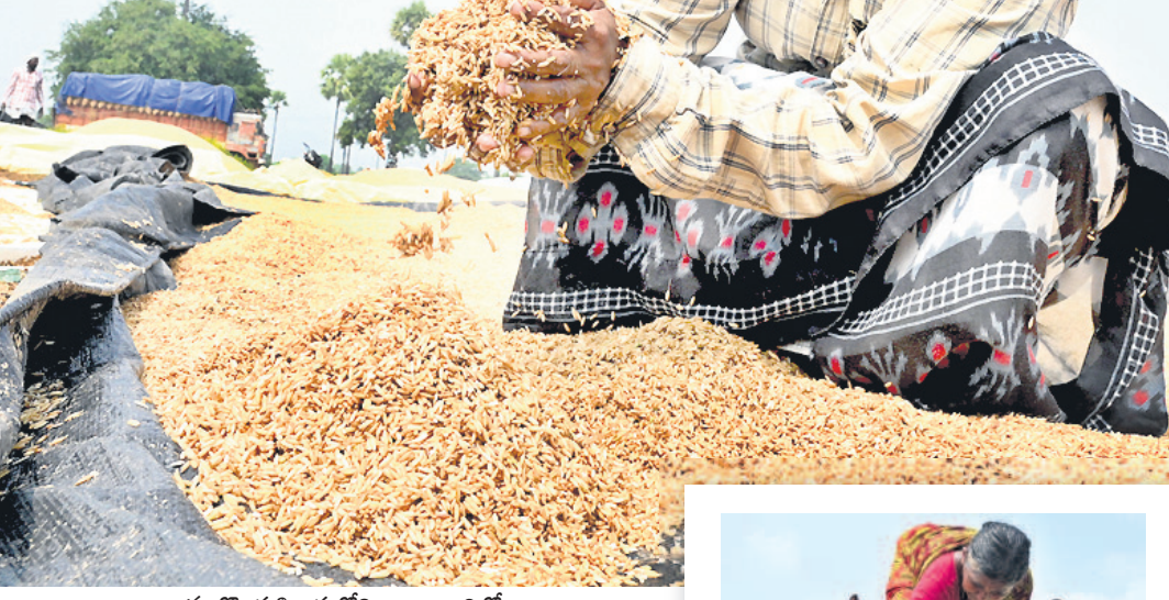
నల్లగొండ శివారులోని ఆర్థికాభివృద్ధి కొనుగోలు కేంద్రంలో తడిసిన ధాన్యాన్ని ఎత్తుకుంటున్న రైతులు

ఎత్తలేదు. మరోవైపు రెడ్డికాలనీ గ్రామంలో సింబర్ ప్రారంభించి నాటి నుంచి కేవలం రెండు లాటాలు మాత్రమే కొనుగోలు చేశారు. అక్కడ ధాన్యం భారీగా తడిసి కొంత వరకు కొట్టుకుపోయింది. తడిసిన ధాన్యాన్ని ఆరబెట్టేందుకు గురువారం రైతులు నానా అవస్థ పడ్డారు. కొనుగోలు కేంద్రాల్లో తడిసిన ధాన్యాన్ని ప్రభుత్వం మద్దతు ధరకు కొనుగోలు చేయాలని డిమాండ్ చేస్తున్నారు. కేసీఆర్ ప్రభుత్వంలో వడ్డ సకాలంలో కొనేవారని చెప్పుకొచ్చారు.