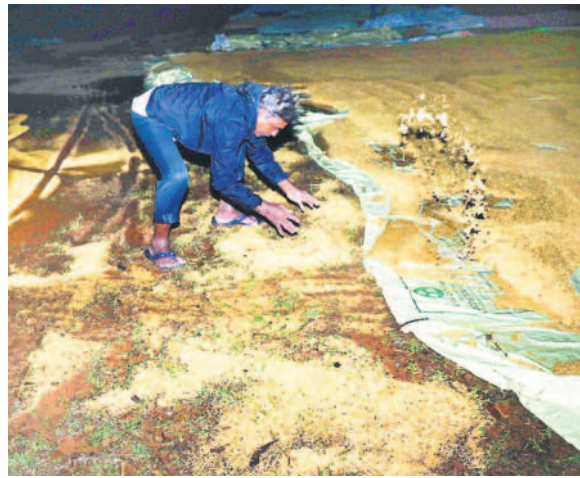
నల్లగొండ మండలంలోని రెడ్డికాలనీ గ్రామంలో పర్లానికి తడిసిన ధాన్యాన్ని ఎత్తుకుంటున్న రైతు

నల్లగొండ రూరల్, నవంబర్ 1 : అన్నదాతలు కష్టపడి పండించిన ధాన్యం ప్రభుత్వం నిర్లక్ష్యంతో కొనుగోలు కేంద్రాల్లోనే తడిసి ముద్ద అవుతున్నది. నల్లగొండ జిల్లాకేంద్రం శివారులోని కొనుగోలు కేంద్రంలో రవాణాలో జరిగిన జాప్యం కారణంగా ఎక్కడి ధాన్యం రాకుండా అక్కడి ఉన్నాయి. బుద్ధవారం సాయంత్రం నుంచి రాత్రి వరకు మూడు గంటలకుపైగా కురిసిన వర్ష వరదలో కొట్టుకుపోయాయి. ఆర్థికాభివృద్ధి కొనుగోలు కేంద్రంలో 84 కుప్పలకు పైగా ధాన్యం 17 శాతం తేమ ఉన్నప్పటికీ సకాలంలో లాభాలు రాకపోవడంతో రోడ్