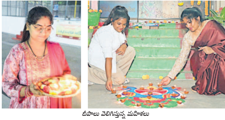
దీపాలు వెలిగిస్తున్న మహిళలు

రామగిరి, నవంబర్ 1 : ఇంటి ముంగిళ్లలో దీపాలు కాంతులు. పోటాపోటీగా పటాకుల మోతలు.. ఆశాంశలో మిరిమిట్ల గొలిపి మెలుగులతో దీపావళి పండుగ ఉమ్మడి జిల్లావ్యాప్తంగా అంబరాన్నంటింది. ప్రజలు గురు, శుక్రవారం రెండు రోజులు పండుగ చేశారు. సరక చతుర్థి సందర్భంగా గురువారం తెల్లవారుజామున నివాళి పట్టారు. ఆ రోజు సాయంత్రంతోపాటు శుక్రవారం తేదారేశ్వర నోములు, లక్ష్మీపూజ చేశారు. శుక్రవారం కూడా అమావాస్య ఉండడంతో అమ్మవారిని కొలిచారు. సాయంత్రం నుంచి రాత్రి వరకూ విన్నాపద్ధ ఉత్సాహంగా పటాకులు కాల్చారు.