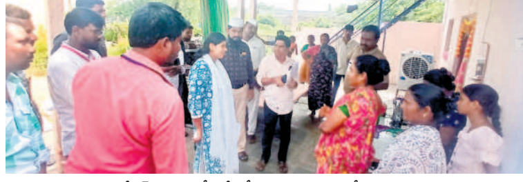
నకిరేకల్ పట్టణంలో సర్వేలో భాగంగా మహిళతో మాట్లాడుతున్న కలెక్టర్ ఇలా త్రిపాలి, పక్కన మున్సిపల్ కమిషనర్ బాలయ్య

నల్లగొండ/నకిరేకల్/జిల్లా కలెక్టర్ ఇలా త్రిపాలి ఎలా చేస్తున్నారనేది ఆరా తీసి కట్టంగూర్/శాలిగారంలో : నవంబర్ 1 : సమగ్ర కుటుంబ సర్వేను పక్కాగా నిర్వహించాలని కలెక్టర్ ఇలా త్రిపాలి ఆదేశించారు. ఇండ్ల జాబితా తయారీ, సర్వే మెటీరియల్ను గురువారం కలెక్టర్ రోడ్లో ఆమె తనిఖీ చేశారు. సర్వే ప్రశ్నాపత్ర, అవసరమైన ఫారాలు, స్పెక్టర్లు, ఇతర అన్ని రకాల సామగ్రి జిల్లాలోని ప్రతి ఎస్టాబ్లిష్మెంట్ కార్యాలయాలకు పంపిణీ చేశారు. కుటుంబ సర్వేను పటిష్టంగా నిర్వహించాలని ఆదేశించారు. కొంతమంది ఉపాధి కమిషన్లు, కమిషనర్ల తయారీచేసిన ఫార్మాట్ను అన్ని మున్సిపాలిటీలకు అందించే అవకాశం ఉన్నట్లు తెలుస్తున్నది. వారి వెంట తాసిల్దార్ ఎన్టీ జమీర్ డ్విన్, సూపర్వైజర్ ఉమ్మల సంతోష్ ఉన్నారు.