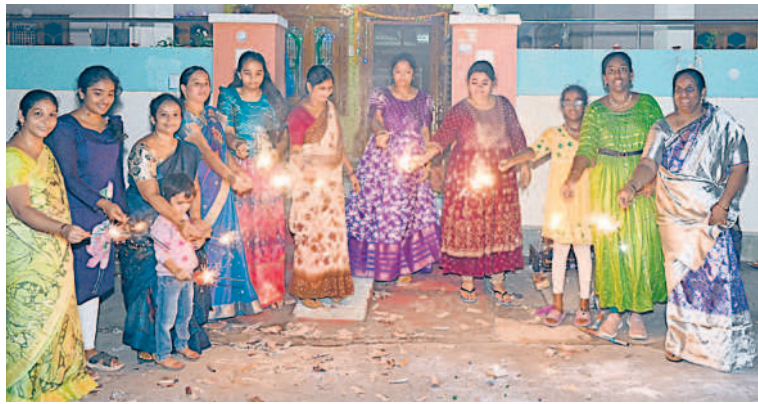
సూర్యాపేటలో కాకరపూలు కాల్పాతున్న మహిళలు