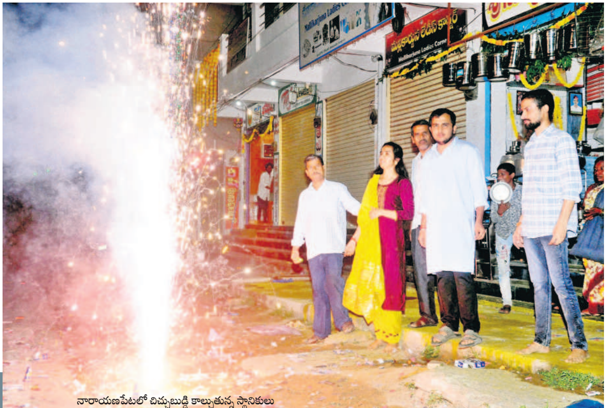
నారాయణపేటలో దివ్యబుద్ధి కాల్వకు స్థానికులు