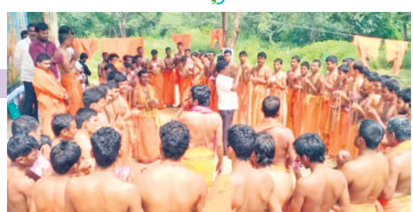
మద్దిమడుగులో అంజనేయస్వామి మాలధారణ స్వీకరించిన స్వాములు (ఫైబి)

వారు. 3.4న హనుమాన్ దీక్షపీఠం లక్ష్మీనగర్ సాగర్ రోడ్డు హైదరాబాద్ తోపాటు అచ్చంపేట, దేవరకొండ, నల్లగొండ, సూర్యపేట, మాచర్ల, గుత్తికోట, కారం పుడి, గుంటూరు ప్రాంతాల్లో మాలధారణ జరుగుతుంది. ఈనెల 21 నుంచి 25 వరకు అర్చనలకు దీక్ష స్వీకరణ ఉంటుంది. డిసెంబర్ 14న సీతారామస్వామి కల్యాణం, హనుమాన్ పడిపూజ, 15న మార్గశిర