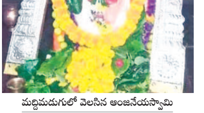
మద్దిమడుగులో వెలసిన అంజనేయస్వామి అచ్చంపేట, నవంబర్ 1 : నల్లమలలోని మద్దిమడుగు అంజనేయస్వామి ఆలయం మరో శబరిపీఠంగా వెలు