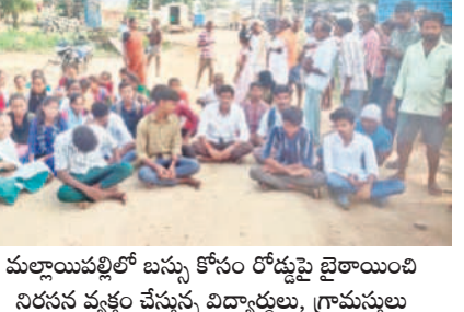
ముల్లాయిపల్లిలో బస్సు కోసం రోడ్డుపై బైటాయింది నిరసన వ్యక్తం చేస్తున్న విద్యార్థులు, గ్రామస్థులు