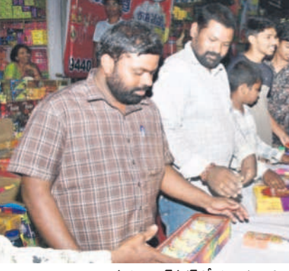
మహబూబ్ నగర్ లో పటాకులు కొనుగోలు చేస్తున్న ప్రజలు

దీపావళి సందర్భంగా ఎంతటి నిరసన కుటుంబాన్ని వీరదీపాన్ని వెలిగించి ముసిసిపోతారు. దీపావళి కంటే ముందు అశ్రయించి బహుశ చతుర్థి వస్తుంది. దీనినే సరళ చతుర్థిగా హైందవ ప్రజలు ఘనంగా జరు చేస్తారు. దీపాలు వెలిగించే చెడు మంచి సాధించే మహాయం గొప్పగా నిర్వహించుకుంటారు. దీపాలను వెలిగించే ప్రమిదల ఎంపిక అంతా ఇంకా కాదు. ముఖ్యంగా దీపాలను మట్టి ప్రమిదల్లో వెలిగించడం సంప్ర దాయం. జిన్నెల ఆశ్చర్యం.. మట్టి ప్రమిదల వినయంగా హైందవ సంస్కృతిలో ఒక భాగం. దీపాన్ని పరమస్వస్వరూపంగా భావిస్తారు. మిగతా రోజుల్లో వివిధ రకాల ప్రమిదల్లో దీపాలను వెలిగించినా.. దీపావళికి మట్టి ప్రమిదల ఉపయోగించడం శుభప్రదమని భావిస్తారు. దీంతో ఏటా బిస్కెట్ అత్త పుట్టి దీపాలు అమ్మకానికి వస్తున్నాయి. చిన్న చిన్న దీపాల నుంచి అడుగు దీపాల వరకు రెండు అంబుటా టాప్ ఉన్నాయి. కొబ్బరికాయ ఆకారంలో దీపం, తుల నీళ్లు, పత్తి పదాలు వెత్తిన దీపం పెట్టుకున్నట్లు, శంఖం, ఠాబేలు, సగ్గిక్, గోడలకు వేలా టీసీ ప్రమిదలు ఇలా చాలా ఉన్నాయి. రూ.2 నుంచి రూ.150 వరకు