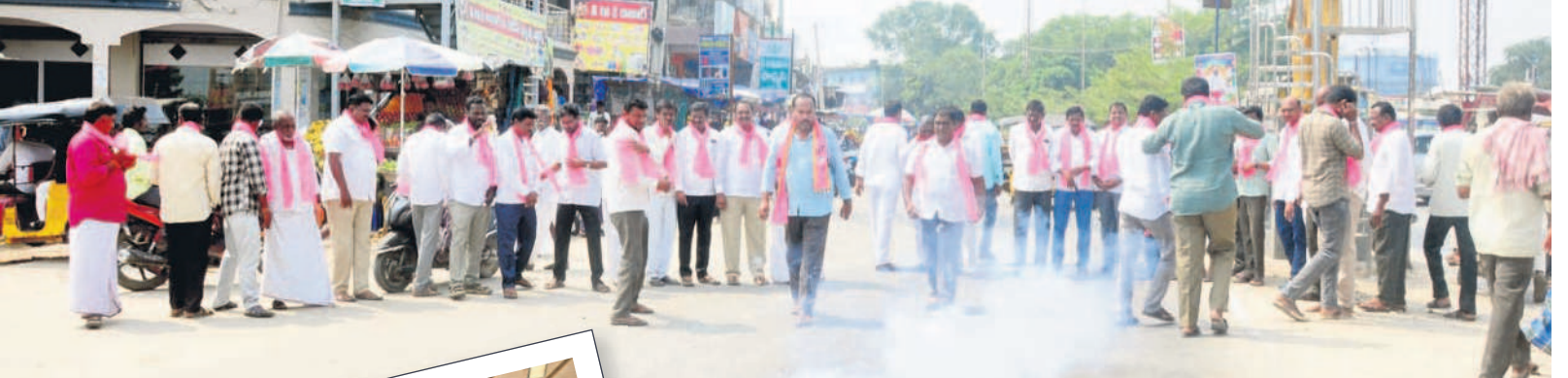
మక్రల్ పట్టణంలోని అంబేద్కర్ చౌరస్తాలో పటాకులు కాల్యాణ్ ముఖర్జీ పాల్గొన్న నాయకులు

భయపడోద్దు అండగా ఉంటాం : కేటీఆర్ ప్రతిపక్షంలో ఉన్నప్పుడు ప్రజల ప్రశ్నలను ప్రశ్నించడంలో తప్పేదీ లేదు భయపడోద్దు. మితి అండగా ఉంటామని వరద ఘానీని జీఆర్ఎస్ వర్గాల వ్యతిరేకంగా ప్రతి పక్షం చేశారు. సీఎంపీకి ప్రశ్నలు లేకుండా ఉండకూడదు. సీఎంపీ అండగా ఉంటామని వరద ఘానీని జీఆర్ఎస్ వర్గాల వ్యతిరేకంగా ప్రతి పక్షం చేశారు. సీఎంపీ అండగా ఉంటామని వరద ఘానీని జీఆర్ఎస్ వర్గాల వ్యతిరేకంగా ప్రతి పక్షం చేశారు. సీఎంపీ అండగా ఉంటామని వరద ఘానీని జీఆర్ఎస్ వర్గాల వ్యతిరేకంగా ప్రతి పక్షం చేశారు.