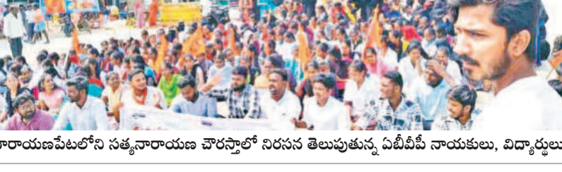
నారాయణపేటలోని సత్యనారాయణ చౌరస్తాలో నిరసన తెలుపుతున్న ఏబీవీపీ నాయకులు, విద్యార్థులు

సిబ్బంది, శాస్త్రవేత్తలు వెల కిందట గ్రామానికి వచ్చి క్షేత్ర స్థాయిలో పంటలను పరిశీలించి.. సాగు చేసే సేవ తడాఖా రకం విత్తనాలు కావని నిర్ధారించారు. కంపెనీ వారు స్పందించి తమకు న్యాయం చేయాలని కోరారు. ఆందోళన విషయం తెలుసుకున్న పోలీసులు ధవారం క్షేత్ర స్థాయికి వెళ్లి పంటలను పరిశీలించారు. సంబంధ దుకాణాలను కూడా తనిబి చేసి సమాచారం సేకరించారు. రైతులకు న్యాయం జరిగేలా చూస్తామని హామీ ఇవ్వడంతో ఆందోళన వీరమించారు.