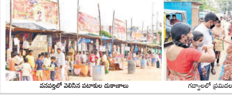
వనపర్తిలో వెలిగిన పటాకుల దుకాణాలు గద్వాలలో ప్రమిదలు కొనుగోలు చేస్తున్న ప్రజలు

అమ్మకాల కోసం ప్రత్యేక షాపులను ఏర్పాటు చేశారు. పూలధరలతో పాటు స్వీట్లు, పటాకుల ధరలు కూడా భారీగా పెరగడంతో కొనుగోలు దారులు ఆందోళన గురవుతున్నారు. గతంలో రూ.500 తీసుకువచ్చే సంచలనం పటాకులు వచ్చేవని ఇప్పుడు రూ.వెయ్యి తీసుకుపో యా అనుకున్న పటాకులు కొన చేపా కొన్నామంటున్నారు. కిరో రూ.800 చొప్పున పటాకులు విక్రయిం డం వీవేవం.