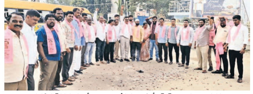
జడ్చర్ల సిగ్నల్ గడ్డ కూడలిలో సంబురాలు చేసుకుంటున్న బీఆర్ఎస్ నాయకులు, కార్యకర్తలు