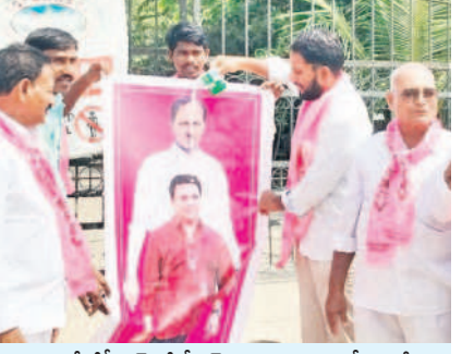
అయిజులో కేటీఆర్, కేటీఆర్ చిత్రపటాలకు క్షీరాభిషేకం చేస్తున్న బీఆర్ఎస్ వీ, బీఆర్ఎస్ నేతలు