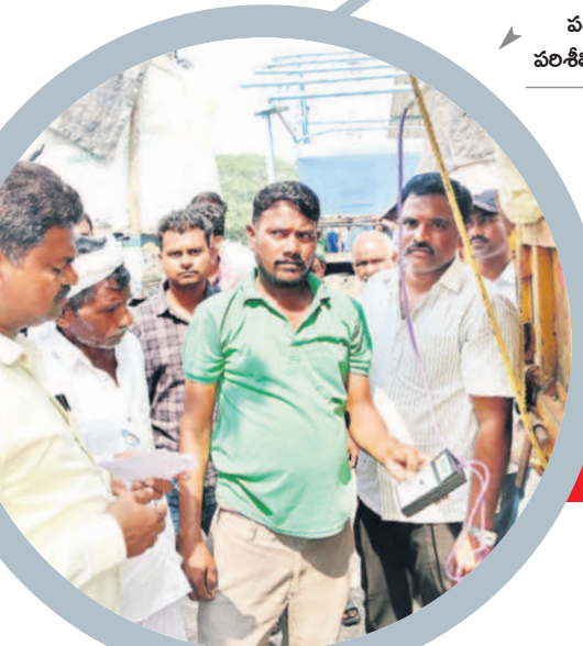
పత్తిలో తేమ శాతం పరిశీలిస్తున్న సీసీవ సిబ్బంది