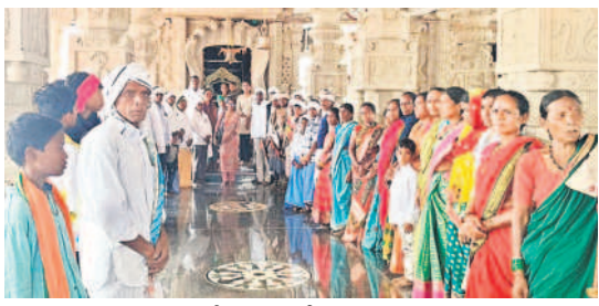
నాగోబా ఆలయంలో పూజలు చేస్తున్న అక్కగూడ ఆదివాసులు