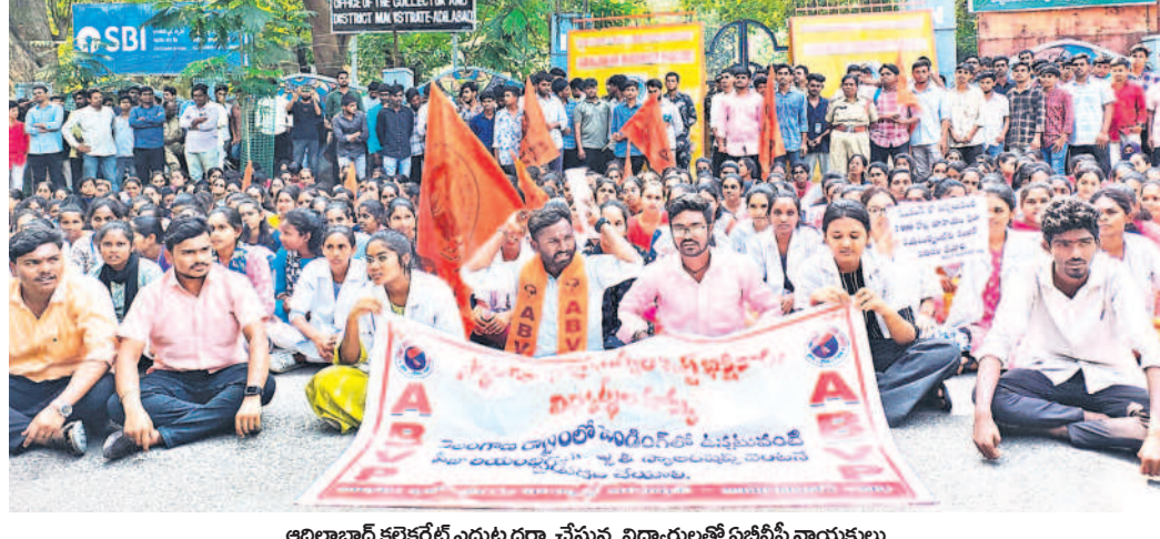
ఆదిలాబాద్ కలెక్టరేట్ ఎదుట ధర్మా చేస్తున్న విద్యార్థులతో ఏబీపీ నాయకులు

రాష్ట్ర ప్రభుత్వానికి సోయి లేకుండా పోయిందని, విద్యార్థులకు న్యాయం చేసే విధంగా రాష్ట్ర ప్రభుత్వం వర్కలు తీసుకోవాలని డిమాండ్ చేశారు. లేని పక్షంలో విద్యార్థుల పక్షాన ఉద్యమాలను తీవ్రతరం చేస్తామని హెచ్చరించారు. నిధులు విడుదల చేయకపోతే సెక్టరీ యెట్ ముట్టడిస్తామని హెచ్చరించారు.