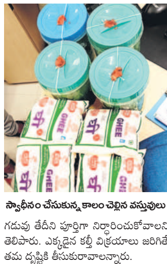
స్వాధీనం చేసుకున్న కాలం చెల్లిన వస్తువులు

నిర్మల్ అర్బన్, అక్టోబర్ 29 : వ్యాపారులు వినియోగదారులకు నాణ్యమైన వస్తువులను విక్రయించాలని ఫుడ్ సెస్టి అధికారిణి ప్రత్యక్ష ప అన్నారు. సోమవారం రాత్రి నిర్మల్ పట్టణంలోని డీ మార్కెట్ కాలం చెల్లిన వస్తువుల విక్రయిస్తున్నారని కార్యాలయ రావడంతో తనిఖీలు నిర్వహించామని తెలిపారు. పండు గ సీజన్ లో వ్యాపారులు పలు వస్తువులను కొనుగోలు చేసేందుకు దుశాశాలకు రావడం కోసం చెల్లిన వెయ్యి ప్యాకెట్లు లభ్యమయ్యాయని, ఆ వస్తువులను స్వాధీనం చేసుకున్నామని తెలిపారు. వీటిలోపాటు మంకొన్ని వస్తువులను స్వాధీనం చేసుకుని ల్యాబ్ కు తరలింపామన్నారు. ఈ సందర్భంగా ఆమె మాట్లాడుతూ.. వస్తువులను కొనుగోలు చేసే వినియోగదారులు ప్రతి వస్తువును పూర్తిగా గమనించాలని.. వస్తువు తయారీ తేదీ,