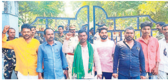
ధర్మా చేస్తున్న తెలంగాణ ఆదివాసీ గిరిజన సమాఖ్య సభ్యులు