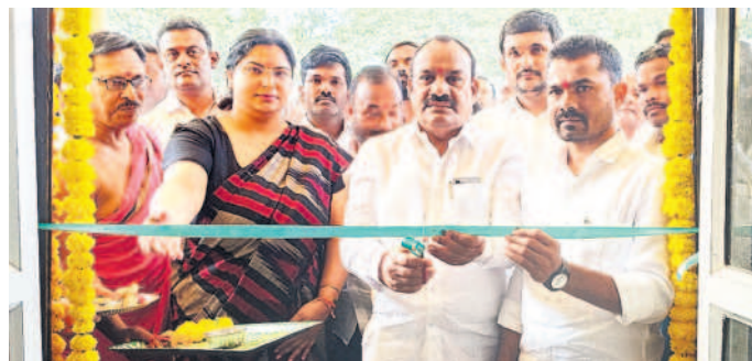
మాతనంగా నిర్మించిన పీహెచ్ సిని ప్రారంభిస్తున్న ఎంపీ, ఎమ్మెల్యే, కలెక్టర్ పీహెచ్ సి, పాఠశాల ప్రారంభం