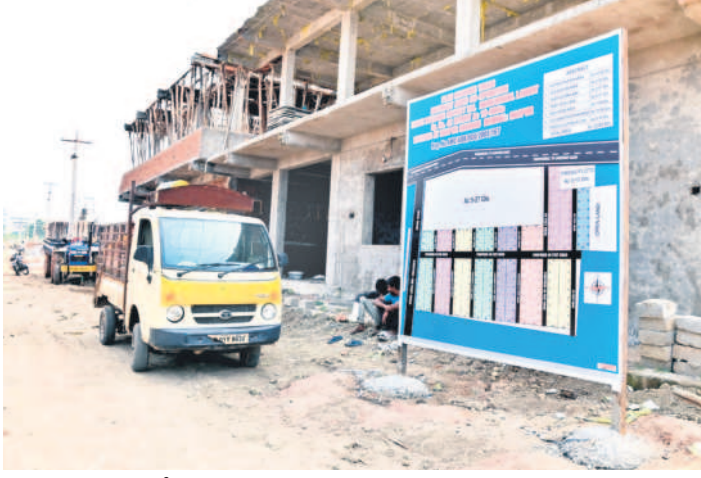
టీఎన్టీవోల ఇండ్లు నిర్మిస్తున్న చోట కొత్తగా వెలసిన బోర్డు