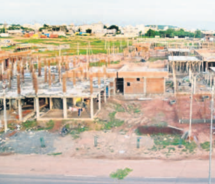
సర్వే నంబర్ 42లో ఇండ్లు నిర్మిస్తున్న టీఎన్టీవోలు

మంచిర్యాల, అక్టోబర్ 29(నమస్తే తెలంగాణ ప్రతినిధి) : టీఎన్టీవో హౌసింగ్ సొసైటీలో అక్రమాల లెక్కలు అధికం అవుతున్నాయి. ప్రతిసారి ఎవరో ఒకరు ఫిర్యాదు చేయడం, దానిపై విచారణ చేయడం, రిపోర్ట్ సబ్మిట్ చేయడం మొదలుపెట్టడం వరకు తప్పిస్తూనే ఉంటుంది. అసలు టీఎన్టీవోల అక్రమాలకు సాక్ష్యాధారాలు ఏమన్నాయని అడిగిన ప్రతిసారి ఉన్నతాధికారుల నుంచి దాటవేసి సమాధానాలే తప్ప.. అసలు విషయం బయటికి వచ్చేది కాదు. కానీ.. ఇప్పుడు టీఎన్టీవో హౌసింగ్ సొసైటీలోని అక్రమాలన్నింటినీ నిరూపించే ఆధారాలు 'నమస్తే తెలంగాణ' చేతికి వచ్చాయి. ఇప్పటి వరకు చేసిన సర్వేలు, టీఎన్టీవోల చేసిన మోసాలపై గతంలోనే కడనూరు ప్రభుత్వం తమయ్యాయి. వాటికి కొనసాగించుతూ టీఎన్టీవోల అక్రమాల లెక్కలన్నీ బయటపెట్టే ఆసలు సాక్ష్యాధారాలను ఇప్పుడు పాఠకుల ముందుకు తెచ్చారు. ఇప్పటికే దానిని విశ్లేషించినట్లు తెలుస్తుంది. అక్రమాలకు కారకులైన టీఎన్టీవోల నాయకులపై కఠిన చర్యలు తీసుకుని, నష్టపోయిన టీఎన్టీవో ఉద్యోగులకు అందగా నిలుస్తారని ఆశిస్తున్నాం.