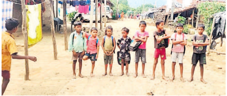
మధ్యాహ్నం ఇంటికి వెళ్ళిన విద్యార్థులు

ధ్యాహ్నం ఇంటికి వెళ్ళున్న విద్యార్థులను గ్రామస్థులు అడ్డుకొని 'ఉపాధ్యాయుడు వెళ్ళిపోయాడు అందుకే మేము ఇంటికి వెళ్ళాము' అని గ్రామస్థులకు విద్యార్థులు తెలిపారు. దీనిపై ఎంకావో రమేష్ బాబును వివక్షణ కోరగా.. నాకు ఎలాంటి సమాచారం ఇవ్వలేదని తెలిపారు. ఇప్పటివరకు ఆ పాఠశాలకు సూతన ఉపాధ్యాయుడు జాయిన్ కాలేదని, అందుకోసం అగ్గిగూడ పాఠశాల నుంచి ఇద్దరు ఉపాధ్యాయుల్లో ఒకరిని డిప్యూటీ పేట్ పంపిస్తున్నామని అన్నారు. మొద్దిగూడ ప్రాథమిక పాఠశాలకు కాన్వీనర్ ఉపాధ్యాయుడిని నియమించాలని కోరుతున్నారు.