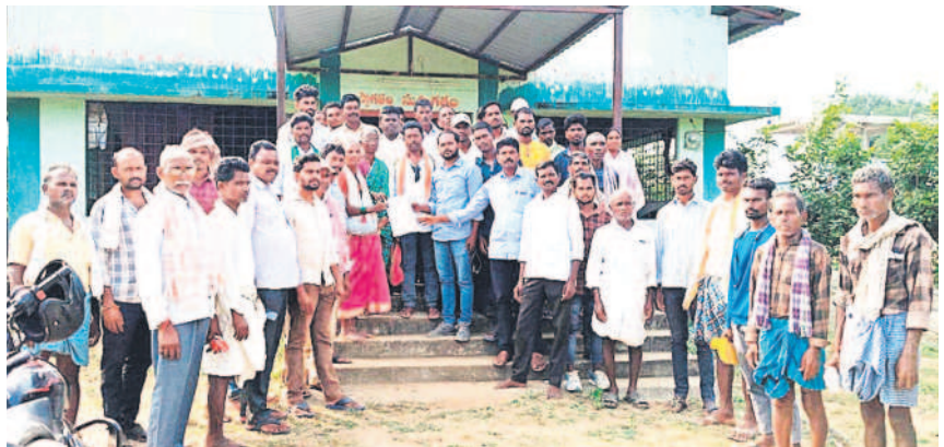
అందోళన అనంతరం ఏకాభిముఖ వినతిపత్రం అందజేస్తున్న రైతులు