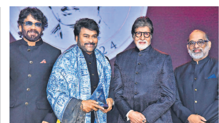
2024 సంవత్సరానికిగాను 'ఏఎన్ఎర్ జాతీయ అవార్డు'ను బాలీవుడ్ నట దిగ్గజం అమితాబ్ బచ్చన్ చేతుల మీదుగా మెగాస్టార్ చిరంజీవి అందుకున్నారు. హైదరాబాద్ అన్నపూర్ణ స్టూడియోల నాగార్జున్, సీని ప్రముఖుల సమక్షంలో ఈ పురస్కార ప్రధాన కార్యక్రమం అట్టహాసంగా సాగింది.

ఇందిరాపార్క్ ధర్మాచౌక్ వద్ద బెటాలియన్ కానిస్టేబుళ్లను ఆర్ఎస్ చేసి తీసుకోవడం పోలీసులు 21 మంది బెటాలియన్ పోలీసుల అరెస్ట్ ధర్మాచౌక్ వద్ద నిరసన.. షోకాట్ నోటీసులు