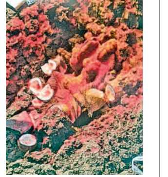
పూజలందుకుంటున్న అమ్మవారి విగ్రహం

పూజలు చేసిన జనం పరంగల్, అక్టోబర్ 27 : పరంగల్ లోని ములుగు రోడ్డు వెల్లోల్ వంట వెనుక భాగంలోని ఇండ్లస్థాయిలో ఏరియాలో నిర్మాణం కోసం చేపట్టిన తవ్వకాల్లో అమ్మవారి విగ్రహం వెలుగు చూసిన విషయం తెలుసుకున్న స్థానికులు భారీగా ఆనందానికి చేరుకుని ఆ విగ్రహాన్ని పెద్దమ్మ తల్లిగా భావించి పూజలు చేశారు. పెద్దమ్మ గడ్డగా పిలిచే ఈ అమ్మవారి విగ్రహం ప్రాంతంలో అమ్మవారి విగ్రహం వెలుగుచూడడంతో పెద్దమ్మ తల్లిగా ప్రజలు చెప్పుకుంటున్నారు. ఈ విషయం నగరమంతా వ్యాపించడంతో చుట్టుపక్కల కాలనీలకు చెందిన ప్రజలు అక్కడికి చేరుకొని అమ్మవారి విగ్రహానికి పూజలు చేశారు.