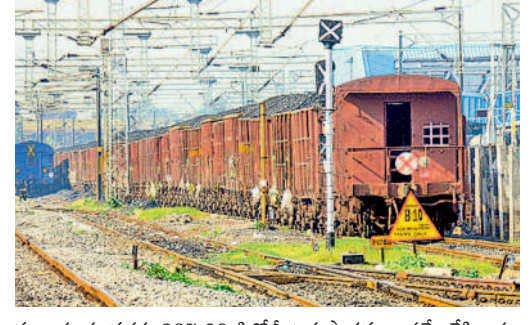
ముజుగూరు వరకు 207.80 కిలోమీటర్ల పొడవునా సర్వే చేసి, భూ సేకరణ జరపాలని ఉత్తర్వులు జారీ చేసింది. భూపాలపల్లి జిల్లాలోని మల్లెల్, భూపాలపల్లి, గణపూర్ మండలాలలో పాటు పెద్దపల్లి జిల్లాలోని ముక్కాపర్, మంధని, రామగిరి మండలాల పరిధిలో సర్వేను అడ్డోవే, సడీ కల్లెర్లె, అడిషనల్ కల్లెర్లెలకు అదేశాలు జారీ చేసింది.

వ్యయం అవుతున్నది. రామగుండం-ముజుగూరు రైల్వే లైన్ పూర్తయితే సుమారు 70 మిలియన్ టన్నుల బోగ్గ రవాణా సులభతరం వుతుంది. దీనివల్ల ఈ ప్రాంతం కోల్ కారిడార్ గా అభివృద్ధి చెందే అవకాశాలున్నాయి. ముజుగూరు నుంచి రామగుండం వరకు 9 రైల్వే స్టేషన్లు ఏర్పాటు చేసే అవకాశం ఉందని సింగరేణి అధికారులు చెబుతున్నారు. భవిష్యత్లో బోగ్గతో పాటు ప్రయాణికుల రైలు సడివీ ఏలుటందని అధికారులు పేర్కొంటున్నారు. ప్రస్తుతం రామగుండం నుంచి కొత్తగూడెం మీదుగా ముజుగూరు వెళ్లాలంటే 349 కిలోమీటర్ల ప్రయాణించాల్సి వస్తున్నది. అయితే తాజాగా రైల్వే శాఖ రామగుండం నుంచి