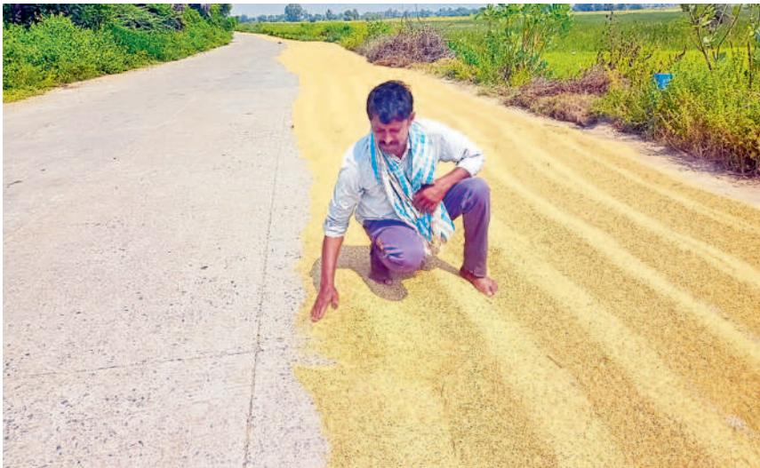
ఉప్పల్లో అరబోసిన సన్నరకం ధాన్యాన్ని చేర్చుతున్న రైతు