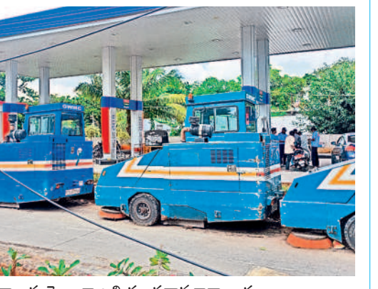
నాలుగు నెలలుగా బల్లియా ప్రధాన కార్యాలయం ఆవరణలో ఉన్న స్వీపింగ్ మిషన్లు