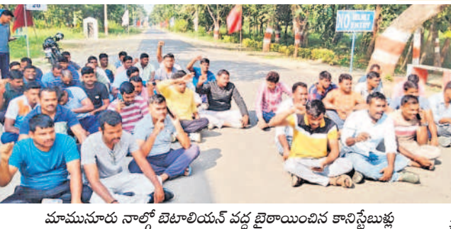
మామూలూరు నాల్గో బెటాలియన్ వద్ద ఖైదీయింది కానిస్టేబుళ్లు

పరంగల్ చౌరస్తా, అక్టోబర్ 27 : రాష్ట్ర వ్యాప్తంగా పోలీస్ సిబ్బందికి ఒకే విధానాన్ని అమలు చేయాలని కోరిన తమను సస్పెన్షన్ చేస్తూ ఇచ్చిన ఉత్తర్వులను వెంటనే వెనక్కి తీసుకోవాలని డిమాండ్ చేస్తూ పరంగల్ జిల్లా మామూలూరు 4వ బెటాలియన్ పోలీస్ కానిస్టేబుళ్ల ధర్మా నిర్వహించారు. ఆదివారం విరామ సమయంలో ప్రధాన ద్వారం వద్ద ఖైదీయింది, ఏకే పోలీస్ విధానాన్ని అమలు చేయాలని డిమాండ్ చేస్తూ నిరాదాని చేశారు. ఉత్తర్వులను వెంటనే రద్దు చేయాలని, లేదంటే నిరసన తెలుపుతున్న కానిస్టేబుళ్లందరినీ సస్పెన్షన్ చేయాలన్నారు. తమ కష్టాలను తీర్చాలని కోరిన వారిని విధుల నుంచి తొలగిస్తామని ప్రభుత్వం బెదిరిస్తున్నదన్నారు. కానిస్టేబుళ్లు నిర్దానితనం చేయకుండా కక్ష సాధింపు చర్యలకు పాల్పడుతున్నారన్నారు. బెటాలియన్ గేటు వద్ద కానిస్టేబుళ్లు చేస్తున్న ధర్మాకు వారి కుటుంబసభ్యులు మద్దతు తెలిపారు. కానిస్టేబుళ్లు అందోళన చేపట్ట