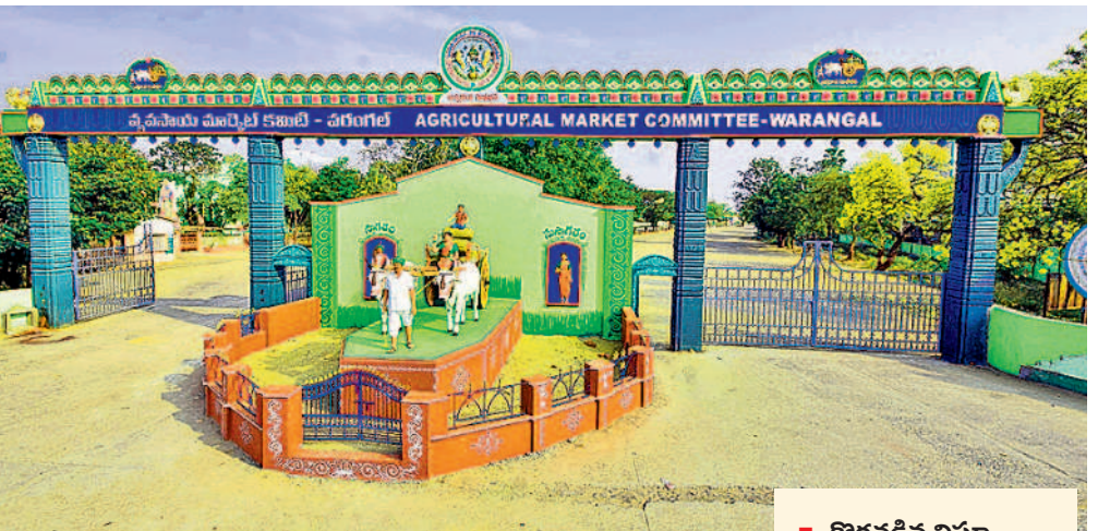
ఎనుమాముల వ్యవసాయ మార్కెట్ ప్రధాన ద్వారం