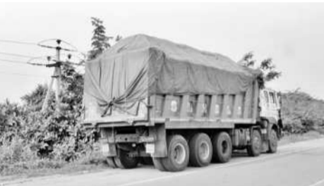
అధికలోతరం వెళ్తున్న బూడిద బీప్పర్

నోలో బోగ్గు నుంచి ఏర్పడిన బూడిదను సిబ్బంది సీమెంట్ ఫ్యాక్టరీలు, ఇటుక తయారీ వ్యాపారులకు నిత్యం వందల టిన్నెట్ల ద్వారా తరలిస్తుంటారు. అయితే లారీల్లో 45 టన్నులలోపు నింపి తరలింపాలి ఉండగా