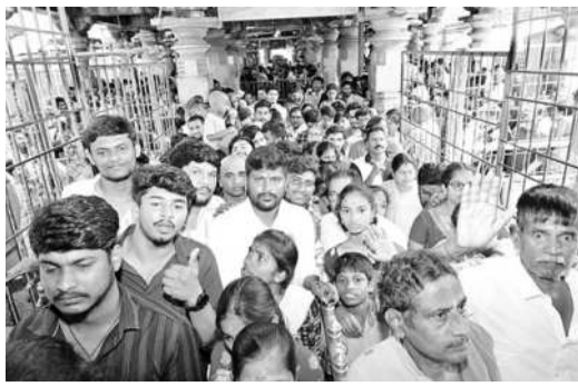
ఆలయ నంది మండపం నుంచి దర్శనాలకు వెళ్తున్న భక్తులు

రావు అన్నారు. వివిధ ప్రాంతాల నుంచి శ్రీశైలానికి వచ్చే యాత్రికులతోపాటు స్థానికంగా వ్యాపారాలు చేసుకునే కొందరు డేవస్టాన్ నిబంధనలను అతిక్రమించడం సమంజసం కాదని హెచ్చరించారు. ఆదివారం డేవస్టాన్ క్షేత్ర పరిధిలోని పలు ప్రాంతాల్లోని పావులలో తనిఖీలు నిర్వహించిన ఆయన మాట్లాడుతూ పాగాకు పదార్థాలతోపాటు మద్యం వంటివి క్షేత్ర ప్రవేశం చేసేందుకు ప్రయత్నించినా, విక్రయాలు చేసిన వారిపై కఠిన చర్యలు తీసుకుంటున్నామని తెలిపారు.