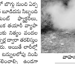
వాహనాలు కూడా కనిపించినంతగా రోడ్డు మొత్తం కమ్మేసిన దుమ్ము

మాగనూరు, అక్టోబర్ 27 : జాతీయ రహదారిపై పడుతున్న బూడిద దుమ్ముతో వాహనదారులు ఇబ్బందులు పడుతూ వాహనాలను నడుపుతున్నారు. కర్ణాటక రాష్ట్రంలోని దేవనూగూరిలోని రాయిచూర్ ధర్మశ్రీ పవర్సిస్టెన్