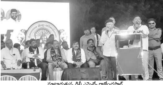
మాట్లాడుతున్న ఢిల్లీ ఎమ్మెల్యే రాజేంద్రపాల్