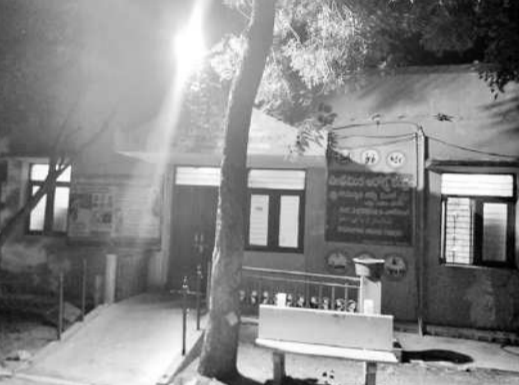
బీకే పడగానే మూసే ఉన్న ప్రాథమిక ఆరోగ్యకేంద్రం

పెద్దకొత్తపల్లి, అక్టోబర్ 27 : మండల కేంద్రంలోని ప్రాథమిక ఆరోగ్య కేంద్రంలో 24 గంటల వైద్యసేవలు అందుబాటులో ఉండాలి ఉండగా, సాయంత్రం 5 గంటలు దాటితే ఆరోగ్యకేంద్రాల్లో సంబంధిత సిబ్బంది లేక ప్రజలు, రోగులు ఇబ్బందులకు గురవుతున్నారు. ఇటీవల తరచూ వర్షాలు కురవడం వల్ల ప్రజలు వైద్యసేవలకోసం దూరస్థానాలకు వస్తుంటారు. రాత్రివేళల్లో దూరస్థానాలకు తాళం వేసుకొనే దర్జనమిస్తుందని ఆందోళన వ్యక్తం చేస్తున్నారు. ప్రభుత్వం ప్రజలకు మెరుగైన వైద్య సేవలు అందించేందుకు దూరస్థానాలలో డాక్టర్, ఎన్ఎంఎంఎల్ను ఏర్పాటు చేస్తే రాత్రివేళల్లో ఎవరూ విధులు నిర్వహించకపోవడంతో ప్రజలు అసౌకర్యాలతో తీవ్ర ఇబ్బందులు ఎదుర్కొంటున్నారు. గర్భిణులు కాన్సర్లతో దూరస్థానాలకు వస్తే స్టాఫ్ నర్సులు డాక్టర్లు లేక మానవదృష్టిలో తీవ్ర ఇబ్బందులు పడుతున్నారు. అనుకోని పరిస్థితుల్లో మృత్యువు తప్పడం వంటివి చోటు చేసుకుంటున్నాయని ఆయా గ్రామాల ప్రజలు పేర్కొంటున్నారు. పెద్దకొత్తపల్లిలో సచివాలయ వైద్యసౌకర్యం నియమించి ప్రజలకు మెరుగైన వైద్యసేవలు 24 గంటలపాటు అందించాలని ప్రజలు కోరుతున్నారు.