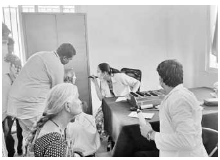
రోగులకు కంటి పరీక్షలు నిర్వహిస్తున్న కంటి వైద్య నిపుణురాలు