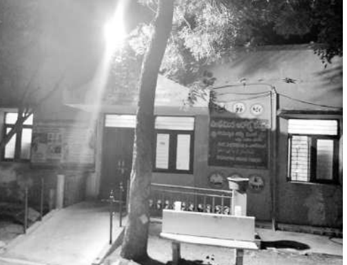
బీకే పడగానే మూసిఉన్న ప్రాథమిక ఆరోగ్యకేంద్రం

ప్రమాదాలు చోటు చేసుకుంటున్నాయని వాహనదారులు ఆందోళన వ్యక్తం చేస్తున్నారు. బైకి నడిపే వారిపై దుమ్ము కంటికి పడి కిందపడిపోవడం దుర్ఘటనలు పాలవస్తున్నాయి. మనీ ఆవేదన వ్యక్తం చేస్తున్నారు. ఈ విషయం నంబం ధిక అధికారులకు తెలిసినా ఎవరూ ఆ వాహనాలపై చర్యలు తీసుకోవడం గమనార్హం. చెక్ పోస్టులో అధికారంలోకి వచ్చినా తిరుగుతున్నాయని తెలిసినా వాటిని పట్టించుకోవడం లేదంటే వాహనాలపై చర్యలు తీసుకోని వాహనదారులు ఆదుపు లోకి తీసుకోవాలని ప్రయాణికులు కోరుతున్నారు.