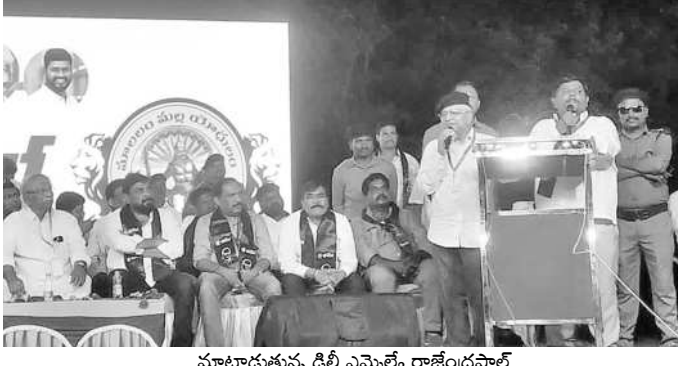
మాట్లాడుతున్న ఢిల్లీ ఎమ్మెల్యే రాజేంద్రపాల్