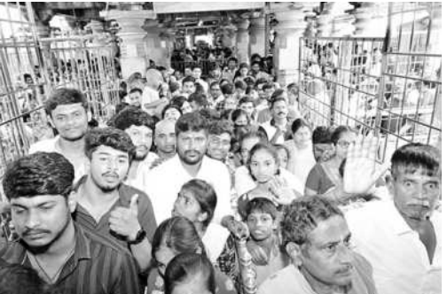
ఆలయ నంది మండపం నుంచి దర్శనాలకు వెళ్తున్న భక్తులు

పెద్దకోత్తపల్లి, అక్టోబర్ 27 : మండల కేంద్రంలోని ప్రాథమిక ఆరోగ్య కేంద్రంలో 24 గంటల వైద్యసేవలు అందుబాటులో ఉండాలి ఉండగా, సాయంత్రం 5 గంటలు దాటితే ఆరోగ్యకేంద్రంలో సందర్శనలు సీబిఎం డి. ప్రజలు, రోగులు ఇబ్బందులకు గురవుతున్నారు. ఇటీవల తరచూ వచ్చే అవస్థలకు వైద్యసేవలకోసం దుర్ఘటనలు వస్తుంటాయి. రాత్రివేళల్లో దుర్ఘటనలు తాళం వేసుకొనే దర్శనమిస్తుందని ఆందోళన వ్యక్తం చేస్తున్నారు. ప్రభుత్వం ప్రజలకు మెరుగైన వైద్య సేవలు అందించేందుకు దుర్ఘటనలకోసం డాక్టర్, ఎన్ఎంఎంఎంలను ఏర్పాటు చేస్తే రాత్రివేళల్లో ఎవరూ విధులు నిర్వహించకపోవడంతో ప్రజలు అసౌకర్యాలతో తీవ్ర ఇబ్బందులు ఎదుర్కొంటున్నారు. గర్భిణులు కాన్సర్లతో దుర్ఘటనలు వస్తే స్టాఫ్ నర్సులు డాక్టర్లు లేక మాన్యువల్లో తీవ్ర ఇబ్బందులు పడుతున్నారు. అనుకోని పరిస్థితుల్లో మృత్యువృత్తి పడిన పులులను చోటు చేసుకుంటున్నాయని ఆయా గ్రామాల ప్రజలు పేర్కొంటున్నారు. పెద్దకోత్తపల్లిలో సచివాలయ వైద్యసేవలను నియమించి ప్రజలకు మెరుగైన వైద్యసేవలు 24 గంటలపాటు అందించాలని ప్రజలు కోరుతున్నారు.