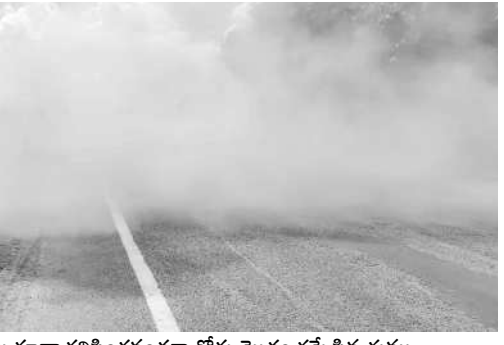
వాహనాలు కూడా కనిపించినంతగా రోడ్డు మొత్తం కమ్మోసిన దుమ్ము

రావు అన్నారు. వివిధ ప్రాంతాల నుంచి శ్రీశైలానికి వచ్చే యాత్రికులతోపాటు స్థానికంగా వ్యాపారాలు చేసుకునే కొందరు డేవస్టాన్ల నిబంధనలను అతిక్రమించడం సమంజసం కాదని హెచ్చరించారు. ఆదివారం డేవస్టాన్ల క్షేత్ర పరిధిలోని పలు ప్రాంతాల్లోని పావులలో తనిఖీలు నిర్వహించిన ఆయన మాట్లాడుతూ పాగాకు పదార్థాలతో పాటు మధ్యం వంటివి క్షేత్ర ప్రవేశం చేసేందుకు ప్రయత్నించినా, విక్రయాలు చేసిన వారిపై కఠిన చర్యలు తీసుకుంటున్నాయని తెలిపారు.