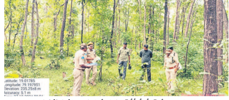
నరికివేసిన టేకు చెట్లను పరిశీలిస్తున్న ఎఫ్డీపీటీ, డిఎఫ్వో, అధికారులు