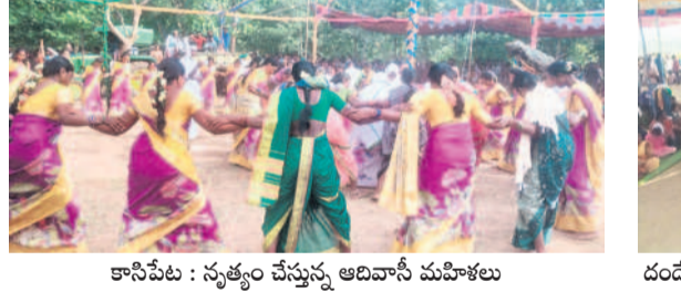
కాసిపేట : నృత్యం చేస్తున్న ఆదివాసీ మహిళలు

దండేపల్లి, అక్టోబర్ 27 : దండారం వేడుకల్లో భాగంగా 'రేలా' పాటలపై గుస్సాడి సృత్యాలతో ఆదివాసీలు పాటించారు. దండేపల్లి మండలం గుడి రేపు గోదావరి తీరంలోని ఆదివాసీ గిరిజనుల ఆరాధ్య దైవం పద్మవతిని కాకో ఆలయానికి దర్శనార్థం ఒక రోజు ముందు ఆదివారం భక్తులు పోలితారు. వివిధ ప్రాంతాల నుంచి తరలివచ్చిన ఆదివాసీలు ఆలయానికి చేరుకొని సంప్రదాయ బద్ధంగా పూజలు చేశారు. దండారం ఉత్పత్తి భాగంగా రేలా...రేలా...అని పాడుతూ గుస్సాడి సృత్యాలను చేశారు. మహిళలు కూడా సంప్రదాయబద్ధంగా సృత్యాలతో సందడి చేశారు. సెలవుదినం కావడంతో భక్తులతో గోదావరి తీరం వద్ద సందడిగా హరించి. ముందుగా గోదావరి నదిలో పుణ్యస్నానాలు చేశారు. పద్మవతిని కాకో అమ్మవారికి నైవేద్యాలు సమర్పించి, మేకలు, కోళ్ల బలి ఇచ్చి మొక్కులు చెల్లించినారు. ఆలయం సమీపంలో వంటలు చేసుకొని సామూహిక భోజనాలు చేశారు. సోమవారం నిర్వహించనున్న గుస్సాడి దర్బారుకు అన్ని ఏర్పాట్లు పూర్తి చేశామని ఆలయ కమిటీ సీనియర్లు తెలిపారు.