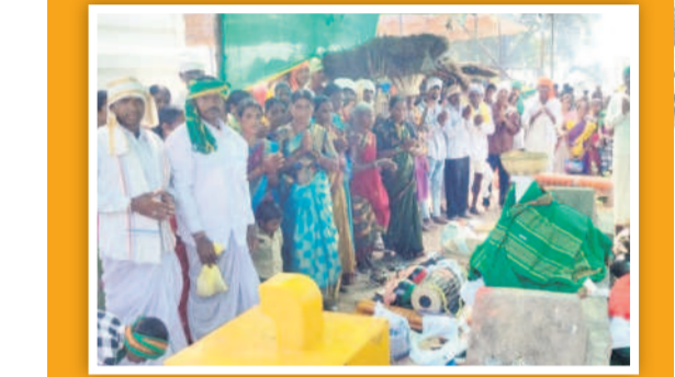
దండేపల్లి : కాకో ఆలయ ఆవరణలో గుస్సాడిల సృత్యాలను