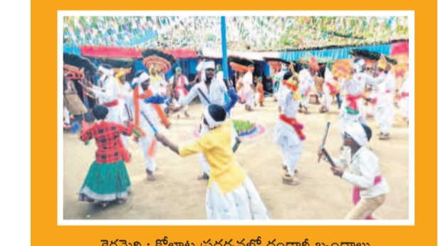
కెరమెరి : కోలాట ప్రదర్శనలో దండారం బృందాలు

దండేపల్లి, అక్టోబర్ 27 : దండారం వేడుకల్లో భాగంగా 'రేలా' పాటలపై గుస్సాడి సృత్యాలతో ఆదివాసీలు పాటించారు. దండేపల్లి మండలం గుడి రేపు గోదావరి తీరంలోని ఆదివాసీ గిరిజనుల ఆరాధ్య దైవం పద్మవతిని కాకో ఆలయానికి దర్శనార్థం ఒక రోజు ముందు ఆదివారం భక్తులు పోలితారు. వివిధ ప్రాంతాల నుంచి తరలివచ్చిన ఆదివాసీలు ఆలయానికి చేరుకొని సంప్రదాయ బద్ధంగా పూజలు చేశారు. దండారం ఉత్పత్తి భాగంగా రేలా...రేలా...అని పాడుతూ గుస్సాడి సృత్యాలను చేశారు. మహిళలు కూడా సంప్రదాయబద్ధంగా సృత్యాలతో సందడి చేశారు. సెలవుదినం కావడంతో భక్తులతో గోదావరి తీరం వద్ద సందడిగా హరించి. ముందుగా గోదావరి నదిలో పుణ్యస్నానాలు చేశారు. పద్మవతిని కాకో అమ్మవారికి నైవేద్యాలు సమర్పించి, మేకలు, కోళ్ల బలి ఇచ్చి మొక్కులు చెల్లించినారు. ఆలయం సమీపంలో వంటలు చేసుకొని సామూహిక భోజనాలు చేశారు. సోమవారం నిర్వహించనున్న గుస్సాడి దర్బారుకు అన్ని ఏర్పాట్లు పూర్తి చేశామని ఆలయ కమిటీ సీనియర్లు తెలిపారు.