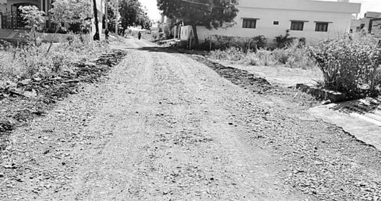
కంకర పోసి వదిలేసిన జయనగర్ కాలనీ జన్మభూమి రోడ్డు

రఘునాథపాలెం, అక్టోబర్ 27: దెబ్బతిన్న రోడ్డుపై వెళ్తున్న తొలగిస్తుంటే.. ఆ కాలనీ వాసులు ఆసనం దుబ్బారు. ఇకమాత్రం కొత్త రోడ్డు పనులపై అనుకోని కోటి అశలతో సంతోషపడ్డారు. కానీ నెలలు గడుస్తున్నా వారి ఆసనాలు, సంతోషాలు ఫలితం లేదు. పైగా రోజురోజుకూ ఇబ్బందులు ఎక్కువవుతున్నాయి. సడిచి వెళ్లినా సదుములు విరిగిపోతే పని అవుతోంది. ఇదీ.. ఖమ్మం కెం.డి.వి.జి. జయనగర్ కాలనీ వెళ్లే జన్మభూమి రోడ్డు పరిస్థితి. ఈ కాలనీలోకి వెళ్లేందుకు గతంలో ఉన్న బీటీ రోడ్డు దెబ్బతిన్నది. దీంతో మరోమారు బీటీ వేసేందుకు నిధులు మంజూరు అయ్యాయి. అయితే పనులు ప్రారంభించిన కాలం దాటింది. మూడు నెలల క్రితం జేసిన సహాయంతో ఉన్న బీటీని తొలగించారు. ఆ పైన కంకర పోసి చదును చేశారు. పనులు జరుగుతుంటే 'మా కాలనీకి కొత్తగా బీటీ వేస్తున్నారు.' అంటూ ఆ కాలనీ వాసులు సంతోష పడ్డారు. కానీ ఆ సంతోషం కంకర పరచడం వల్లే పరిమితమైంది. మూడు నెలలుగా పనులు నిలిచిపోయింది. మూడు నెలలుగా పనులు నిలిచిపోయింది. మూడు నెలలుగా పనులు నిలిచిపోయింది.