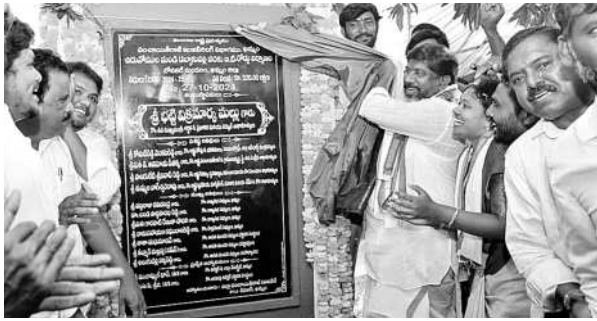
బీటీ రోడ్డు శంకుస్థాపన చేస్తున్న డిప్యూటీ సీఎం

అభివృద్ధి పనుల శంకుస్థాపనలో డిప్యూటీ సీఎం భట్టి