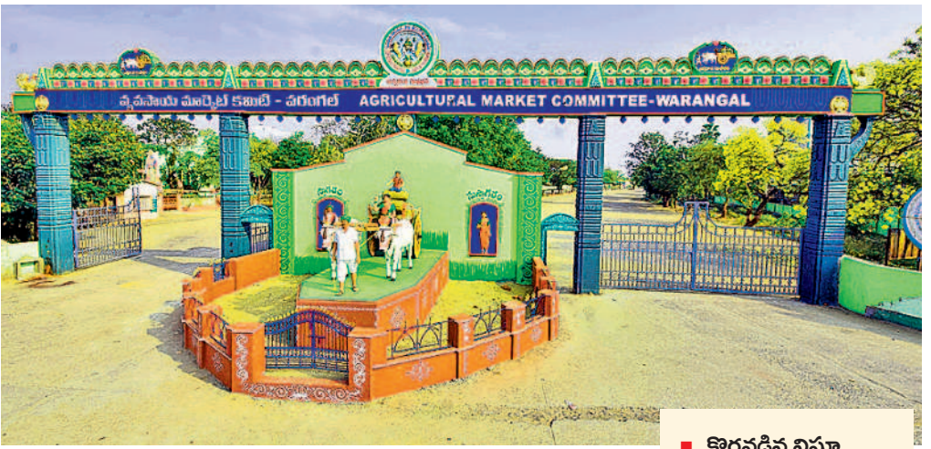
- వరంగల్, అక్టోబర్ 27 (నమస్తే తెలంగాణ)

ఆసియాలో అతిపెద్దదైన వరంగల్ ఎనుమాముల వ్యవసాయ మార్కెట్ కు ఆదాయం బాగానే వస్తున్నా మౌలిక వసతులు కరువయ్యాయి. గత 2023-24 ఆర్థిక సంవత్సరంలో రూ. 43.39 కోట్ల ఆదాయం వచ్చినా రైతులను సమస్యలు వెక్కిరిస్తున్నాయి. మార్కెట్ లో నిధుల కొరవడంతో యార్డుల్లో పంట ఉత్పత్తులు చోరీ జరుగుతున్నది. సీసీ కెమెరాలు పనిచేయకపోగా, కొత్తవి అమర్చడంతో అధికార యంత్రాంగం నిర్లక్ష్యం కనబరుస్తున్నది. కనీసం తాగునీరు అందుబాటులో లేకపోవడంతో రైతులు అల్లాడుతున్నారు. ప్రభుత్వం స్పందించి మార్కెట్ లో సదుపాయాలు కల్పించాలని వారు కోరుతున్నారు.