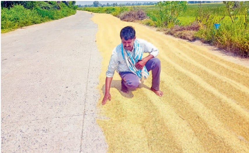
ఉప్పల్లో అరబోసిన సన్నరకం ధాన్యాన్ని చేర్చుతున్న రైతు