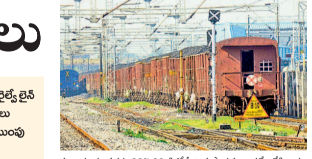
ముణుగూరు వరకు 207 కిలోమీటర్ల పొడవునా సర్వే చేసి, భూ సేకరణ జరపాలని ఉత్తర్వులు జారీ చేసింది. భూపాలపల్లి జిల్లాలోని మల్లెల్, భూపాలపల్లి, గణపూరు మండలాలలో పాటు పెద్దపల్లి జిల్లాలోని ముత్తూరు, మంధని, రామగిరి మండలాల పరిధిలో సర్వేను అడ్డపే, సడీ కల్లెర్లెర్, అడిషనల్ కలెక్టర్లకు ఆదేశాలు జారీ చేసింది.

వ్యయం అవుతున్నది. రామగుండం-ముణుగూరు రైల్వే లైన్ పూర్తయితే సుమారు 70 మిలియన్ టన్నుల బొగ్గు రవాణా సులభతరం వుతుంది. దీనివల్ల ఈ ప్రాంతం కోల్ కారిడార్ అభివృద్ధి చెందే అవకాశాలున్నాయి. ముణుగూరు నుంచి రామగుండం వరకు 9 రైల్వే స్టేషన్లు ఏర్పాటు చేసే అవకాశం ఉందని సింగరేణి అధికారులు చెబుతున్నారు. భవిష్యత్లో బొగ్గుతో పాటు ప్రయాణికుల రైలు సడివీ వీలుంటుందని అధికారులు పేర్కొంటున్నారు. ప్రస్తుతం రామగుండం నుంచి కొత్తగూడెం మీదుగా ముణుగూరు వెళ్లాలంటే 349 కిలోమీటర్ల ప్రయాణం చేయాల్సి వస్తున్నది. అయితే తాజాగా రైల్వే శాఖ రామగుండం నుంచి