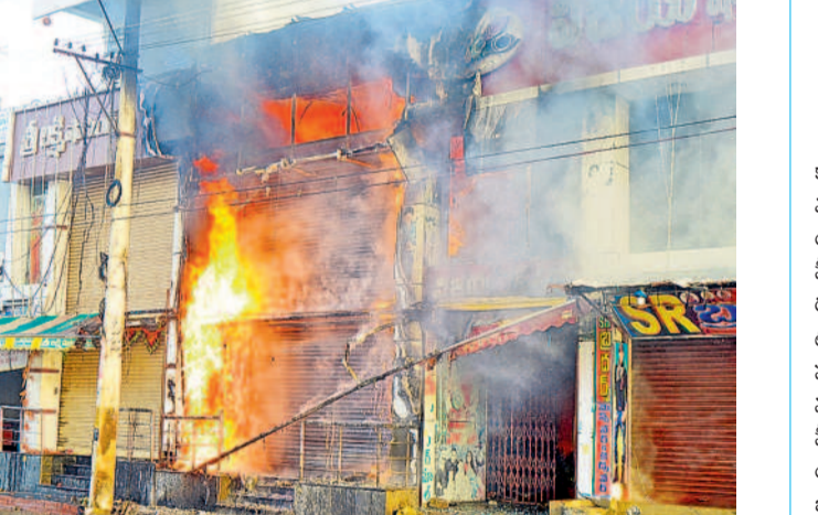
మంటల్లో కాళిపోతున్న షాపింగ్ మార్ట్

య్యారు. వెస్ట్ జోన్ డీపీటీ రాజమహేంద్రవరం రెస్కూయర్స్ పోల్స్ ని మంటలు ఆర్పి ప్రయత్నం చేశారు. జనగామలో పాటు వ్యాపనమనివ్వడం, పాలకుర్తి, మోతూరు, ఆలేరు, భువనగిరి, యాదగిరిగుట్ట నుంచి ఏడు ఫైర్ ఇంజిన్లను రప్పించి మంటలను అదుపు చేశారు. ఉదయం 6 నుంచి సాయంత్రం 6 గంటల వరకు రెస్కూయర్స్ ఆపరేషన్ కొనసాగింది. ట్రాఫిక్ కు అంతరాయం కలగకుండా ఏసీటీ పార్లర్స్ రద్దీ నేతృత్వంలో అగ్ని సేవ దామాచర్ల రెడ్డి బందోబస్తు నిర్వహించారు. అగ్నిమాపకశాఖ అధికారులు సకాలంలో స్పందించి ఉంటే ఇంత పెద్ద ప్రమాదం జరిగి ఉండేది కాదని స్థానికులు ఆరోపణలు చేస్తున్నారు.