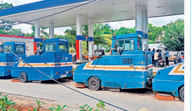
నాలుగు నెలలుగా బల్లియా ప్రధాన కార్యాలయం ఆవరణలో ఉన్న స్వీపింగ్ మిషన్లు

వరంగల్, అక్టోబర్ 27 : గ్రేటర్ కార్పొరేషన్ లోని స్వీపింగ్ మిషన్లు మూలన పడ్డాయి. కోట్లాది రూపాయలు వెచ్చించి కొనుగోలు చేసిన స్వీపింగ్ మిషన్ల నిర్వహణపై అధికారులు నిర్లక్ష్యం వహిస్తున్నారని. మిషన్ల బిందర్ల ముగిసి నాలుగు నెలలు గడుస్తున్నా పట్టణమంతటా లేదు. దీంతో నగర ప్రధాన రహదారులను ఊడ్చే స్వీపింగ్ మిషన్లు బల్లియా కార్యాలయంలో పడి ఉన్నాయి. వీటి వినియోగ బాధ్యతలను ప్రకారంగా విభాగం చూసుకుంటుండగా, బిందర్లను మాత్రం ఇంజనీరింగ్ విభాగం పిలవాలి ఉంది. దీంతో రెండు విభాగాల మధ్య సమస్యయి తోవంతో ఈ మిషన్లు మూలన పడ్డాయి. బిందర్లతో నిర్లక్ష్యం స్వీపింగ్ మిషన్ల బిందర్ల ముగిసి సుమారు 8 నెలలు గడుస్తున్నా ఇప్పటి వరకు బల్లియా అధికారులు మళ్లీ బిందర్లను పిలువలేదు. దీంతో గ్రేటర్ లోని 12 స్వీపింగ్ మిషన్లు మూలన పడ్డాయి. బిందర్ల పొందిన ఏజెన్సీలు వాటి మొయింటెన్స్, డ్రైవర్ల వేతనం, వాహనాల రిపేర్లు, డీజిల్ నింపడం తదితర బాధ్యతలను చూసుకుంటాయి. స్వీపింగ్ రూల్స్ మ్యాన్ గో చేస్తుంటే పని చేయించుకోవడం ప్రకారంగా విభాగం చూసుకుంటుంది. 6 పెద్ద స్వీపింగ్ మిషన్లు, మరో 6 చిన్న మిషన్లు ఉన్నాయి.