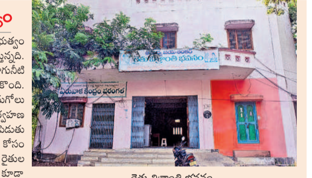
రైతు విశ్రాంతి భవనం

మార్కెట్ నిర్వహణపై ప్రభుత్వం నిర్లక్ష్యంగా వ్యవహరిస్తున్నది. యార్డుల్లో కనీసం రైతులకు తాగునీటి వసతి కల్పించని పరిస్థితి నెలకొంది. దీంతో వాటర్ బాటిళ్లు కొనుగోలు చేస్తున్నారు. టాయిలెట్ల నిర్వహణ సరిగా లేదని రైతులు గగ్గోలు పెడుతున్నారు. ఇక మహిళా రైతుల కోసం ప్రత్యేక ఏర్పాట్లు లేవు. రైతుల విశ్రాంతి భవనం నిర్వహణ కూడా అటెన్షన్ లో లేదు. బెడ్స్ ప్యాకెట్ల ఉండగా తాగునీటి వంటి వసతి లేదు. కొన్ని సందర్భాల్లో రైతులకు బెడ్స్ ప్యాకెట్లతో విశ్రాంతి భవనంలోని గదుల్లో నేలపై పడుకుంటున్నట్లు తెలిసింది. యార్డుల్లో ఎలక్ట్రానిక్ కాంట్రాల్ రైతులకు పంట ఉత్పత్తులను తూకం వేయడంలో ఇంటర్నెట్ సమస్య వెంటాడుతోంది. వైపు మెరుగుపరచాలనే ప్రతిపాదన కూడా అమర్చలేకపోయారు. మార్కెట్ నిర్వహణ కోసం ప్రభుత్వం 109 రెగ్యులర్ ఉద్యోగుల పోస్టులను మంజూరు