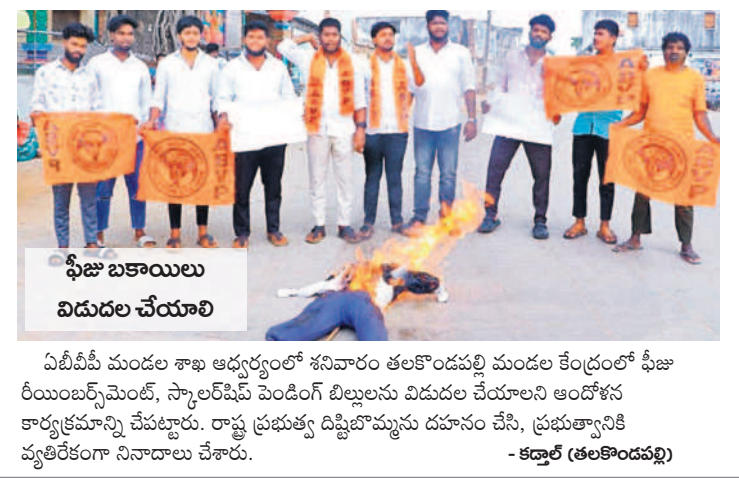
ఫీజు బకాయిలు విడుదల చేయాలి

ఏటీఎస్ మండల శాఖ ఆధ్వర్యంలో శనివారం తలకొండపల్లి మండల కేంద్రంలో ఫీజు రీయింబర్స్మెంట్, స్కాలర్షిప్ పెండింగ్ లిబ్రలను విడుదల చేయాలని ఆందోళన కార్యక్రమాన్ని చేపట్టారు. రాష్ట్ర ప్రభుత్వ డిప్యూటీ ముఖ్యమంత్రి దూరం చేసి, ప్రభుత్వానికి వ్యతిరేకంగా నివాదాలు చేశారు.