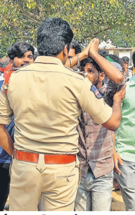
సీఎంకె కాంగ్రెస్ నాయకులే కావాలా..?

సీఎం రేవంత్ రెడ్డికి తన సెగ్మెంట్ లోని రైతులు అవసరం లేనట్లుగా ఉన్నది. గత 8 నెలలుగా ఫార్మా కంపెనీల ఏర్పాటు వద్దే.. వద్దు అంటూ ధర్మాలు, రాష్ట్రాధికారులు, పాదయాత్రలో నిరసన తెలుపు తున్నా.. మా గురించి ఒక్క మాట కూడా మా ట్రాడర్లకు లేదు. అధికారులను చంపింది ప్రదేశాలకు గురిచేస్తున్నారు. రోజువారీ తండ్రుల జీవితాలను లాభిదార్లలో పలువురు రైతులు సామూహిక పదేపదేయారు. వారిని చంపారానించేమందుకు సీఎంకె సమయమేలేదా..? రేవంత్ రెడ్డికి కాంగ్రెస్ నాయకులే ముఖ్యమం.. రైతులు అవసరం లేదా..?