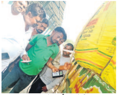
పత్తి నష్టాన్ని పరిశీలిస్తూ సిబ్బంది

కేంద్ర ప్రభుత్వం ప్రకటించిన మద్దతు ధర క్వింటాలుకు రూ.7,521 ఉండగా.. 300లకుపైగా వాహనాల్లో రైతులు పంటను సీసీపి అమ్మడానికి తీసుకొచ్చారు. పంటలో తేమ శాతం 8 నుంచి 12 వరకు ఉంటే కొనుగోలు చేస్తామని అధికారులు ప్రకటించి సేకరణకు నిరాకరించారు. దీంతో రైతులు తేమతో సంబంధం లేకుండా కొనుగోలు చేయాలని కోరారు. ఇందుకు వారు ఒప్పకొకపోవడంతో ప్రైవేటు వ్యాపారులతో బోధ ఎమ్మెల్యేలను ఆసక్తిగా కలెక్టర్ రాజ్ పా, ఎస్పీలు చర్చలు జరిపారు.