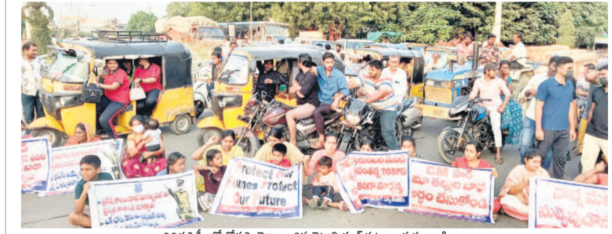
వివిధ షెక్సీలతో రోడ్డుపై భిక్షయించిన బెటాలియాను కుటుంబ సభ్యులు, పిల్లలు