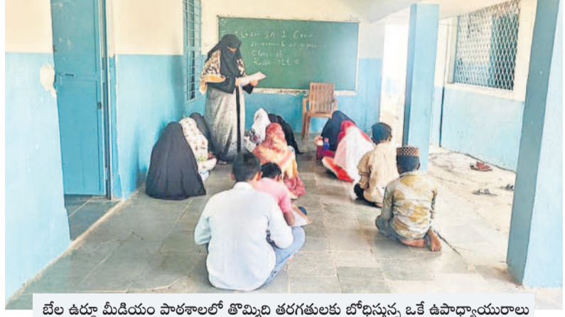
బేల ఉర్దూ మీడియం పాఠశాలలో తొమ్మిది తరగతులకు బోధిస్తున్న ఒకే ఉపాధ్యాయురాలు