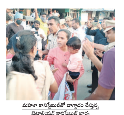
మహిళా కానిస్టేబుల్తో వాగ్దానం చేస్తున్న బెటాలియాను కానిస్టేబుల్ భార్య