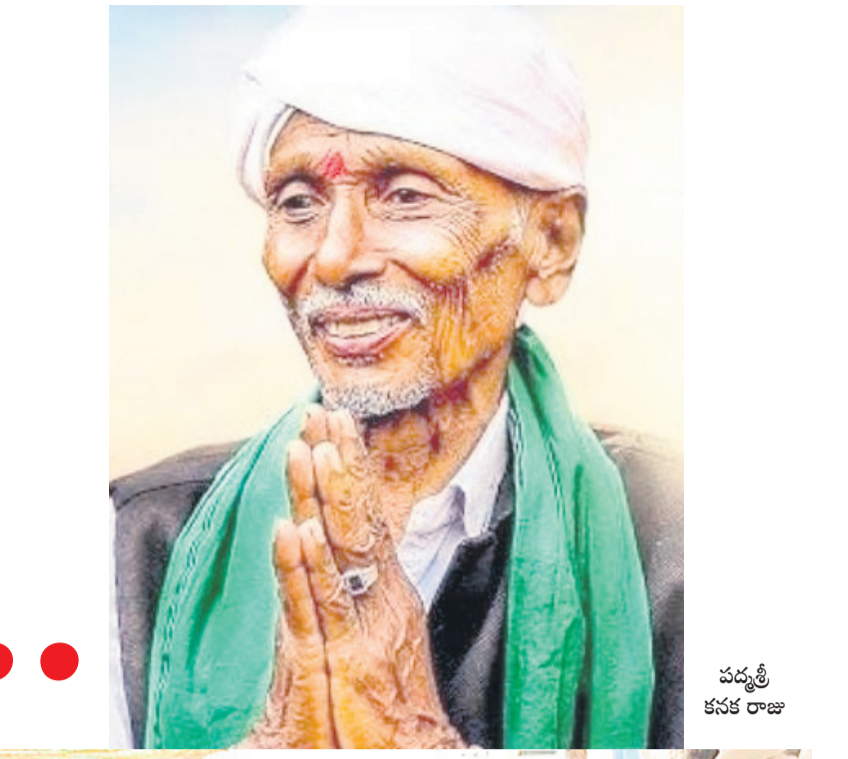
పద్మశ్రీ కనక రాజు