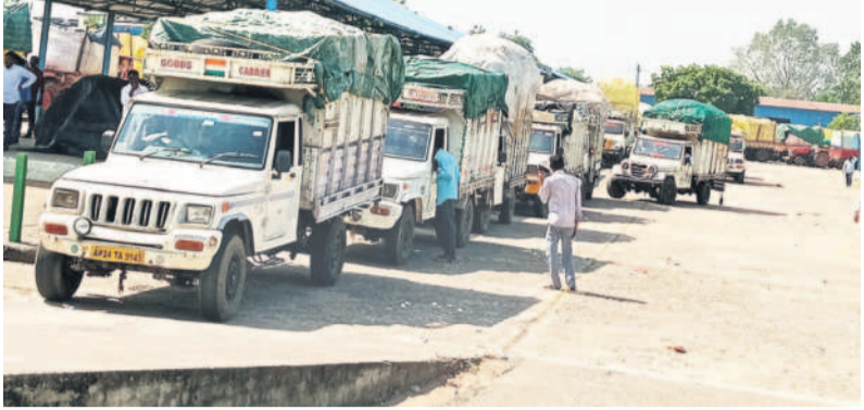
ఆదిలాబాద్ మార్కెట్ యార్డులో పత్తి వాహనాలు

ఆదిలాబాద్, ఆక్టోబర్ 26(నమస్తే తెలంగాణ) : ప్రభుత్వ నిర్ణయం, ప్రైవేటు వ్యాపారుల అపకార వాదం ఫలితంగా ఆదిలాబాద్ జిల్లా రైతులు ఆది లోనే కష్టాలు ఎదుర్కొంటున్నారు. ఆదిలాబాద్ మార్కెట్ యార్డులో శుక్రవారం ఉదయం 10 గంట లకు ప్రారంభించిన కొనుగోళ్లు.. సీసీపి అధికార లు తెలుపేదిపట్టడంతో ఒక రోజు ఆలస్యంగా శనివారం ఉదయం ప్రారంభమయ్యాయి. శుక్రవారం రాత్రిగా రైతులు పంటకు కాసలాగా ఉన్నారు. 24 గంటలపాటు తిండి, తిప్పలు లేక సీసీపి అధికారులు కొనుగోళ్లను ఆపివేసి ధరకు ప్రైవేటు వ్యాపారులకు విక్రయించి ఇంటింటి పట్టారు. మార్కెట్ యార్డులో కొనుగోళ్లు ఎన్నో గౌన ఆలం పరిశీలించారు.