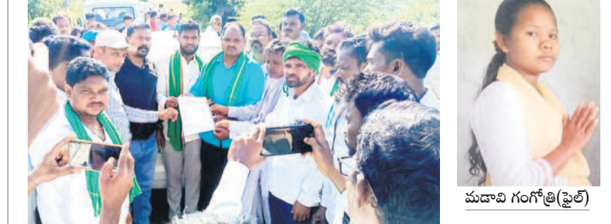
తుడుంబెట్టు నాయకులు, వాల్గొండ పెద్దలకు రాసిన ఓప్పండ్ పత్రాన్ని అందజేస్తూ అధికారులు

సంఘాల నాయకులు, కుటుంబ సభ్యులు ఆదివాసీ సంఘాల నాయకులతోపాటు వాల్గొండ గ్రామ పెద్దలతో చర్చించారు. గంగోత్రి కుటుంబ సభ్యులకు న్యాయం చేయాలని అప్పుడే మృతదేహాన్ని గ్రామాలకి తరలిస్తామని ఆదివాసీ సంఘాల నాయకులు డిమాండ్ చేశారు. దీంతో ఐటీడిఎ ఏటిడబ్ల్యూవో క్రాంతి, సీపిఎం గిరిజన ఆశ్రమంలో గంగోత్రి కుటుంబానికి ఐటీడిఎ ఓసినో మిషన్ పడకం ద్వారా రూ.2లక్షల ఆర్థిక సహాయంతోపాటు కుటుంబంలో ఒకరికి ప్రభుత్వ ఉద్యోగం కల్పిస్తామని హామీ ఇవ్వడంతో అంత్యక్రియలు నిర్వహించారు.