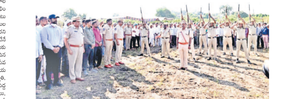
అధికారిక లాంఛనాల్లో భాగంగా గాలిలోకి కాల్పులు జరుపుతున్న పోలీసులు