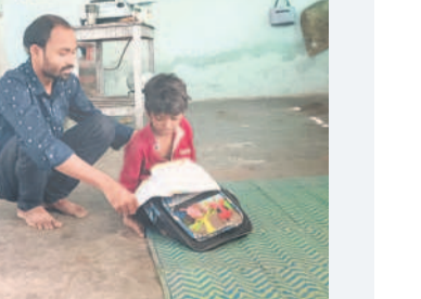
మొహబత్పూర్ పాఠశాలలో బాలుడికి ఒక టీచర్

బేల, ఆక్టోబర్ 26 : ఆదిలాబాద్ జిల్లా బేల మండలంలోని పలు పాఠశాలల్లో విచిత్ర పరి స్థితి నెలకొన్నది. విద్యార్థులు లేనివరకు ఉపాధ్యాయులు పనిచేస్తున్నారు. చాలా మంది విద్యార్థులు ఉన్న చోట ఉపాధ్యాయులు తక్కువగా ఉన్నారు. ఫలితంగా బోధన అస్తవ్యస్తంగా మారింది.