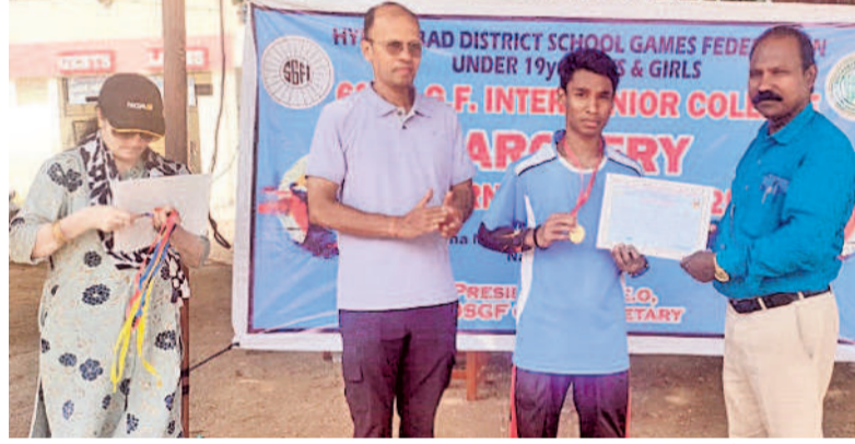
హైదరాబాద్ స్కూల్ గేమ్స్ ఫెడరేషన్ ఆధ్వర్యంలో నిర్వహించిన ఆర్డర్ పోటీల్లో స్వర్ణ పతకం సాధించిన బాలుర డివిజన్ల బంధువుల సమితి సభ్యులు

హైదరాబాద్, అక్టోబర్ 26: తెలంగాణ స్కూల్ గేమ్స్ ఫెడరేషన్ ఆధ్వర్యంలో నిర్వహించిన పోటీల్లో బాలుర చిన్నారులు ఆర్డర్లో తమ సత్కారాలు సాధించారు. హైదరాబాద్ జిల్లా ఆర్డర్లో తమ సత్కారాలు సాధించారు. హైదరాబాద్ జిల్లా ఆర్డర్లో తమ సత్కారాలు సాధించారు.