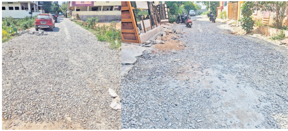
మూడు నెలల క్రితం కంకర పోసి వదిలేసిన సామనగర్ కాలనీ రోడ్డు