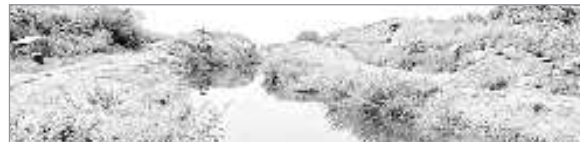
నిలిచిన నంది రిజర్వాయర్ నుంచి లింక్ కాల్వ నిర్మాణం

అగార్ ఫుడ్ను ఉపయోగించే ఉత్పత్తులు • అగార్ ఫుడ్లు, ధూసం • అత్తల తయారీ • జిడ్డు గొర్రెలు, లైసెంట్లు • మెడిసిన్, ట్రీన్ టీపాకి • గృహోపకరణాలు అదాయం తెచ్చుకొమ్మలతో దాదాపు 25 నుంచి 30పిండ్ల పాటు ఎదురుచూడాలి. అదే అగార్ ఫుడ్ను సాగుచేస్తే నాలుగిండ్లకే అదాయం కక్షజూరొచ్చును నిపుణులు పేర్కొంటున్నారు. ఒకసారి సాగుచేస్తే 40పిండ్లపాటు పలు రకాలుగా ఈ చెట్లు అదాయం తెచ్చిపెట్టుతుంది. మినీకా చెట్లతో పోలిస్తే అగార్ ఫుడ్ చెట్లకు బీడపీడల ప్రభావం ఉండదు. ఈ చెట్ల పంపిణీని అధికంగా మలుచుకొని బలంగా పెరుగుతుంది. నాణ్యత నాలుగిండ్లకు చెట్ల కాస్త లాపు అయ్యాకా కాండానికి కండ్రాలు పెట్టి పంపిణీని ఎక్కిస్తారు. దీంతో కాండం లోను రెజిన్ లాంటి పదార్థం విడుదలై కొన్ని రకాల రసాయనాలను విడుదల చేయడంతో అగార్ ఫుడ్ సుగంధ భరితమవుతుంది. అనంతరం ఆ చెరకు తొలగించి సేకరించి చెక్కముక్కలను కిలోల చొప్పున విక్రయిస్తారు. ఒక చెట్లకు ఆరునెలల్లో సుమారు మూడు కిలోల వరకు చెక్క ముక్కలు వస్తే కిలో ధర రూ.లక్ష నుంచి రూ.9లక్షల వరకు ఉంటుంది.