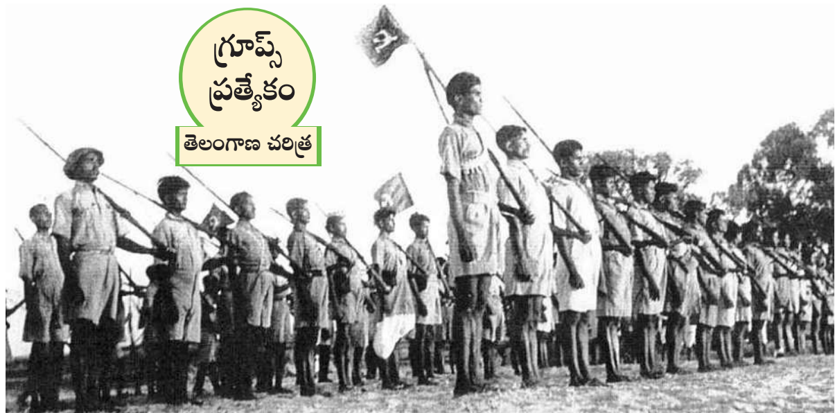
గ్రూప్ ప్రత్యేకం తెలంగాణ చరిత్ర