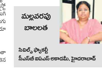
మల్లవరపు బాలలత నివోల్ స్పాకెట్టి సీఎస్ఐఐ ఐఎస్ఎ లకాడమి, హైదరాబాద్

బోయింగ్ స్ట్రాటోలైసర్ క్యాప్సూల్లో అంతరిక్ష కేంద్రానికి వెళ్లారు. వ్యావహారిక జూన్ 14న వీరిద్దరూ భూమికి తిరిగి ప్రయాణం కావాల్సి ఉండగా వ్యోమ నౌక (స్ట్రాటోలైసర్)లో హియోను లీకేజీ కారణంగా సాంకేతిక సమస్యలు తలెత్తడంతో ఈ ఇద్దరు వ్యోమగాములూ అంతరిక్షంలో చిక్కుకుపోయారు. ఈ సమస్యను పరిష్కరించి వారిని తిరిగి భూమి మీదకు తీసుకొచ్చేందుకు స్పేస్ ఎక్స్ క్రూ 9 మిషన్ నానా చేపట్టింది.