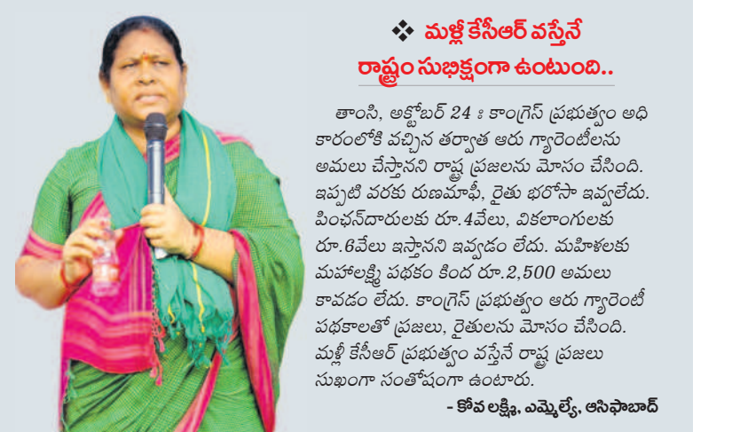
మళ్ళీ కేసీఆర్ వస్తేనే రాష్ట్రం సుఖభంగా ఉంటుంది..