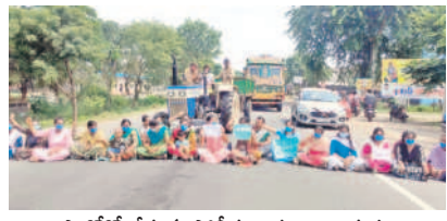
రాష్ట్రంలోకి చేస్తున్న పోలీసుల కుటుంబ సభ్యులు

హాజీపూర్, అక్టోబర్ 24 : 'పోలీసులా, లేక కూలిలా.. షాశతో వెట్టిచాకలి చేయిస్తారా.. అంటూ గురువారం మంచిర్యాల జిల్లా హాజీపూర్ మండలం గుడిపేటలోని 18వ ప్రత్యేక తెలంగాణ పోలీస్ బెటాలియన్ ముందు జాతీయ రహదారి-693పై పలువురు కార్నెట్లకు షాశతో కలిసి ధర్మాకు దిగారు. బెటాలియన్ల పై స్టాంపు అధికారులకు సేవలు చేయించుకోవడంపై ఆగ్రహం వ్యక్తం చేశారు. టీకే ఎస్సీ డౌన్.. అంటూ నినాదాలు చేశారు. వారు మాట్లాడుతూ సంఘ విల్లోహా శక్తులను కట్టడి చేసి.. ప్రజలకు సేవ చేయడమే లక్ష్యంగా పోలీసు ఉద్యోగంలో చేరిన వారితో కూలి పనులు చేయించడమేమిటని మండిపడ్డారు. తమిళనాడు, కర్నాటక రాష్ట్రాల మార్ది విధానాన్ని