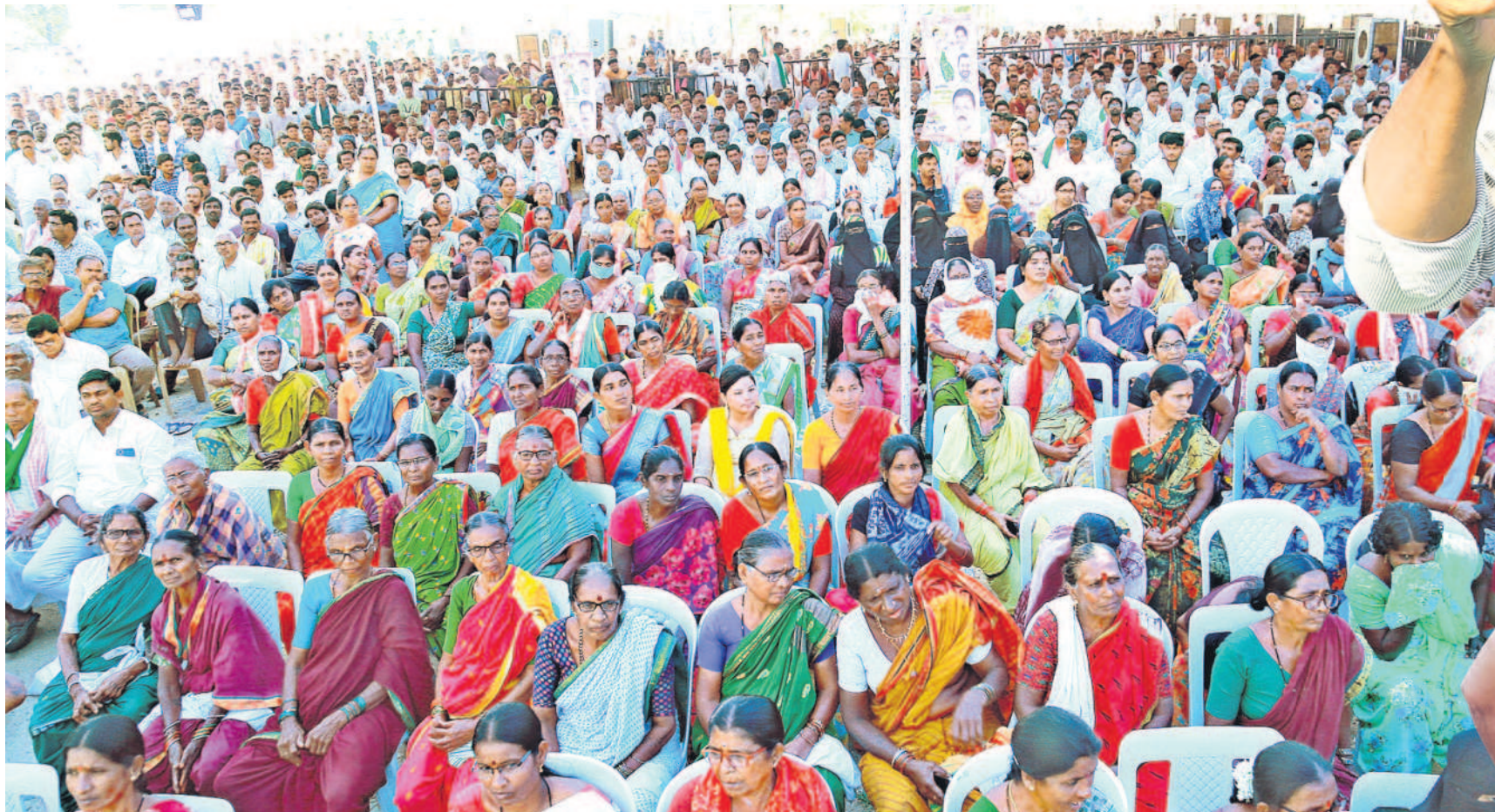
అదిలాబాద్ జిల్లా కేంద్రంలోని రాంఠీలా మైదానంలో నిర్వహించిన నిరసన సభకు తరలివచ్చిన అశేషజనవాహిని