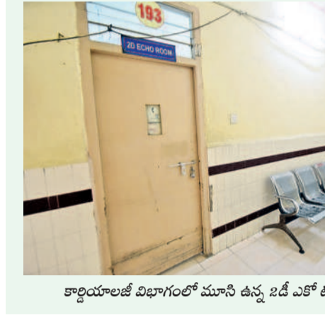
కార్డయాలజీ విభాగంలో మూసీ ఉన్న 2డి ఎకో టెస్ట్ రూం

వరంగల్, అక్టోబర్ 24 (నమస్తే తెలంగాణ) : పేరుగొప్ప ఊరు దిబ్బలా తయారైంది వరంగల్ ఎంజీఎం ఆస్పత్రి పరిస్థితి. ఉత్తర తెలంగాణ ప్రజలకు గుండెకాయ వంటి ఈ వెద్దాస్పత్రిని సమస్యల జబ్బు వెంటాడుతున్నది. వైద్యులు, సిబ్బంది, యంత్రాలు అందుమూలం లేదు. ఈ టెస్టు కోసం రోగులను అంబులెన్స్లో కాకతీయ మెడికల్ కాలేజీ (కేఎంసీ) వచ్చుతున్నారు. ఇక్కడ 2డి ఎకో టెస్ట్ చేసే వేషం కేఎంసీకి వెళ్లి రావాల్సి ఇబ్బందితో పాటు అంబులెన్స్ వాడాలి అవసరం కూడా తప్పకుండా.