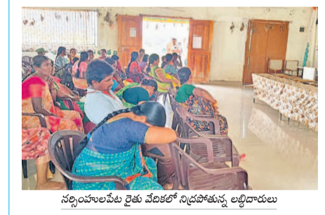
సర్పంచలపేట రైతు వేదికలో నిర్వహించిన అధిదారులు