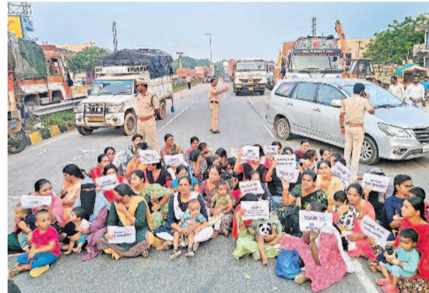
గద్వాల జిల్లా ఎర్రపల్లి మండలంలోని జాతీయ రహదారిపై పిల్లలతో కలిసి ధర్నా చేస్తున్న పదోబెటాయన్ సిబ్బంది భార్యలు