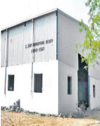
మౌలిక సౌకర్య కల్పన గుర్తింపు వివాదాల్లో కల్లాలపూర్ గోడౌన్