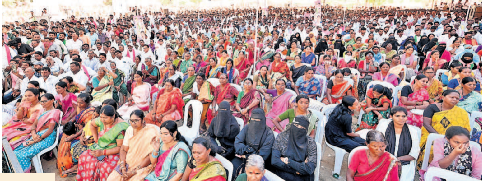
అదిలాబాద్ లోని రాంలిలామైదానంలో గురువారం బీఆర్ఎస్ ఆధ్వర్యంలో రైతు నిరసన సభకు వివిధ గ్రామాల నుంచి పెద్దఎత్తున తరలివచ్చిన రైతులు