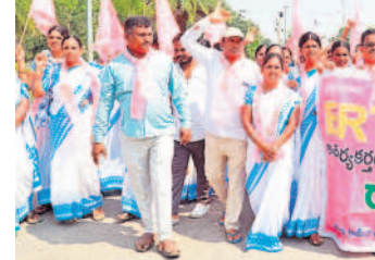
బీఆర్ఎస్ యూత్ అధ్యక్షులతో కలెక్టరేట్ ఎదుట నిరసన వ్యక్తం చేస్తున్న ఆశలు