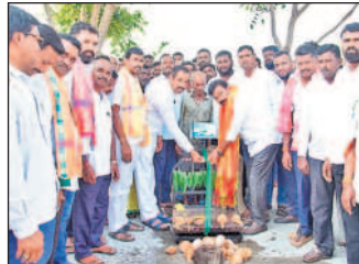
ధాన్యం కొనుగోలు కేంద్రాల ప్రారంభం