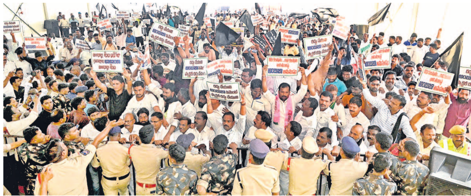
అంబుజా సి.మెంట్ ఫ్యాక్టరీ పక్కనే ఎన్టీఆర్ రోడ్డుపై రామన్నపేటలో జరిగిన ప్రజాభిప్రాయ సేకరణ వద్ద గోబ్బాట్ అదానీ అంటూ నిరసన తెలుపుతున్న ప్రజలు

PUBLISHED FROM HYDERABAD • KARIMNAGAR • WARANGAL • KHAMMAM • NALGONDA • MAHABUBNAGAR • NIZAMABAD www.ntnews.com 06 /ntdailyonline