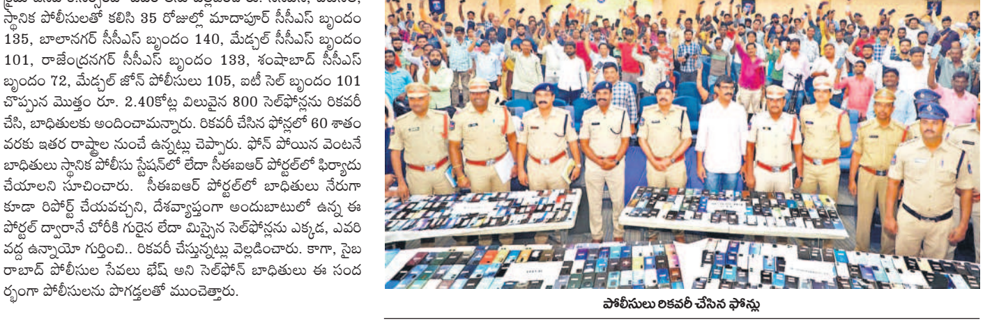
పోలీసులు లికవరీ చేసిన ఫోన్లు