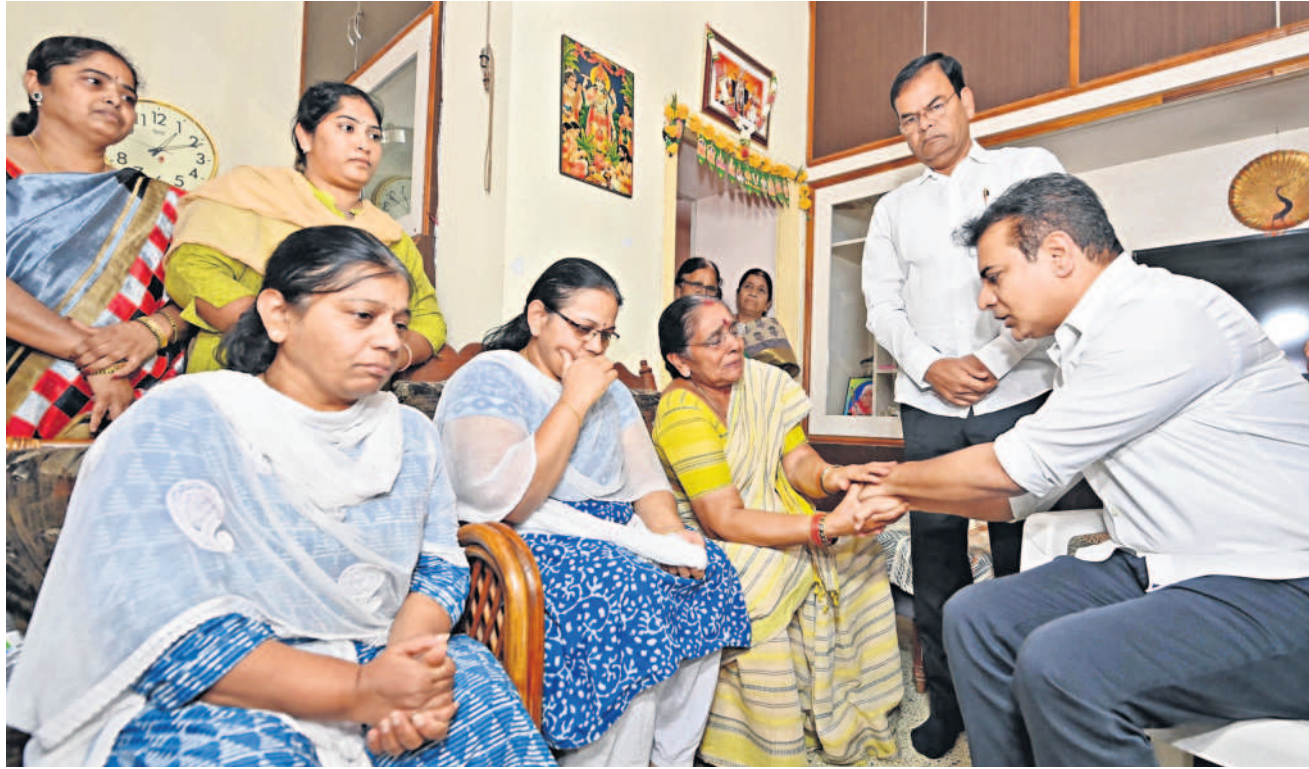
లింగారెడ్డి కుటుంబసభ్యులను ఓదారుస్తున్న జీఆర్ఎస్ వర్కర్స్ ప్రెసిడెంట్ కేటీఆర్