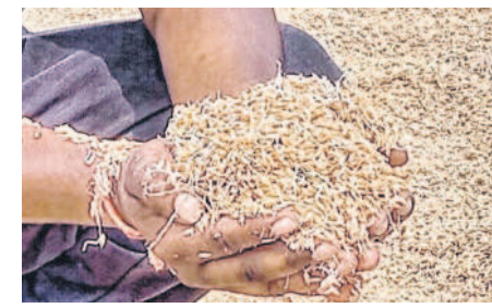
హైద్రాబద్లో ధాన్యానికి మొలకలు వచ్చాయని చూపుతున్న రైతు

కేంద్రాలకు ధాన్యం.. ప్రారంభంకాని తూకం లింగంపేట మండలంలోని తెల్లూర్, కొనుగోలు కేంద్రాలకు, కన్నాపూర్, హోలంపేట గ్రామాల్లో మంగళవారం కురిసిన వర్షానికి ధాన్యం తడిసింది. ఆయా గ్రామాల్లో ప్రభుత్వం ఏర్పాటు చేసిన కొనుగోలు కేంద్రాలకు రైతులు ధాన్యాన్ని తీసుకువచ్చినా ఇప్పటివరకూ తూకం ప్రారంభం కాలేదు. దీంతో అమ్మకానికి తెచ్చిన ధాన్యం తడిసిముద్దయ్యింది. ధాన్యం ఆరబెడుకుండా తిరిగి వర్షం కురియడంతో ధాన్యం రంగుమాడడంతోపాటు మొలకలు కూడా వచ్చే అవకాశం ఉన్నది. రైతులు ఆందోళన చేస్తున్నా సరే ప్రారంభం లేదని వారం రోజులు గడుస్తున్నా తూకం లభించే వారం రోజులు గడుస్తున్నా తూకం లభించు ప్రార్థించాల్సిన రైతుల అధికారులు అనుభవం చేస్తున్నారు.