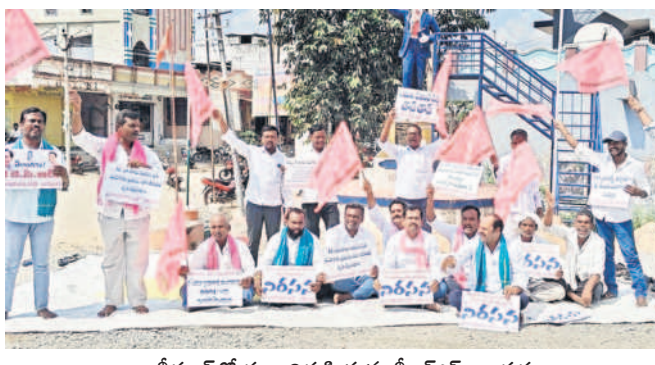
బీర్పూర్లో ధర్మా నిర్వహిస్తున్న బీఆర్ఎస్ నాయకులు