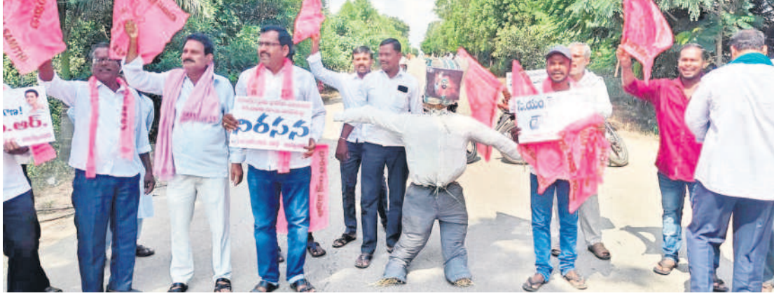
దామరంపల్లె సీఎం రేవంత్ రెడ్డి దిప్తిబామ్మను ఊరేగిస్తున్న బీఆర్ఎస్ శ్రేణులు