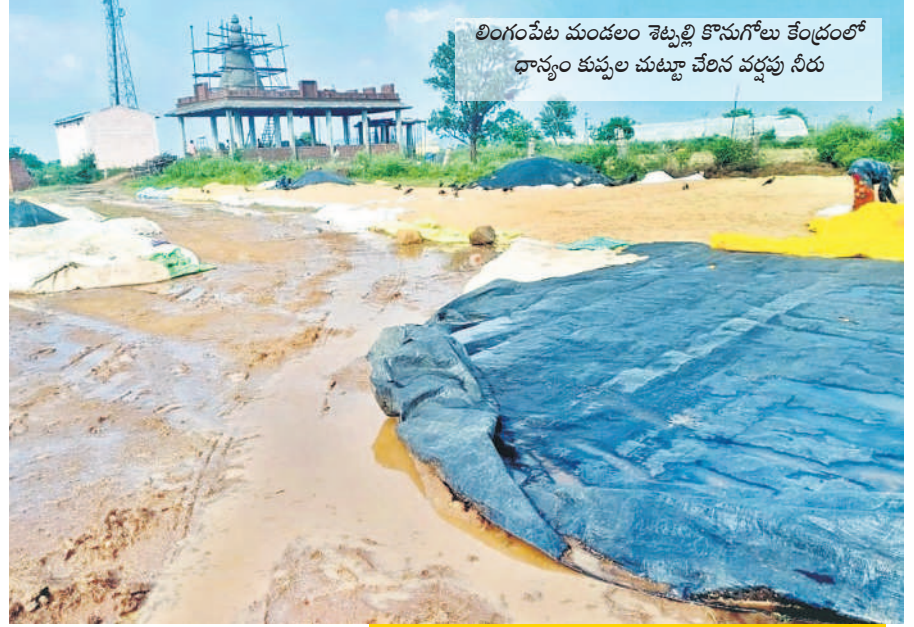
లింగంపేట మండలం తెల్లూర్లో కొనుగోలు కేంద్రంలో ధాన్యం కప్పలు మట్టా వేలన వర్షపు నీరు