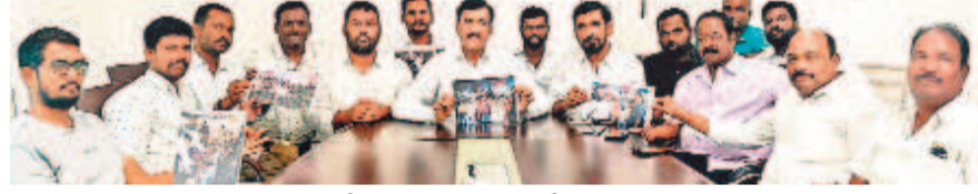
గజ్జెల్లో మీడియా సమావేశంలో ఎన్నికలకు ముందు చేపందేళ్ల బిక్ష చేసిన పోలీసులు మామిళ్లున్న వంటిరు ప్రతాపరెడ్డి, బీఆర్ఎస్ నాయకులు