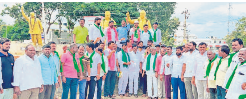
రైతులకు న్యాయం జరిగేలా కాంగ్రెస్ పార్టీకి బుద్ధి ప్రసాదించాలని మహేశ్వరంలో అంబేద్కర్ కమిటీ పత్రం అందిస్తున్న బీఆర్ఎస్ నేతలు