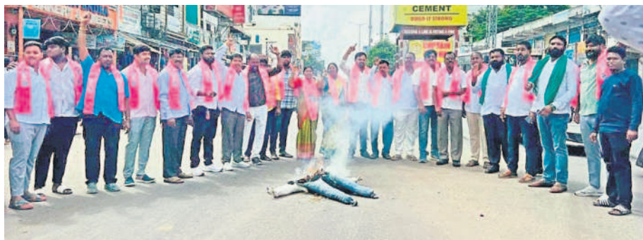
తుక్కుగూడలో సీఎం రేవంత్ రెడ్డి దిష్టిబొమ్మ దహనం చేస్తున్న బీఆర్ఎస్ నేతలు