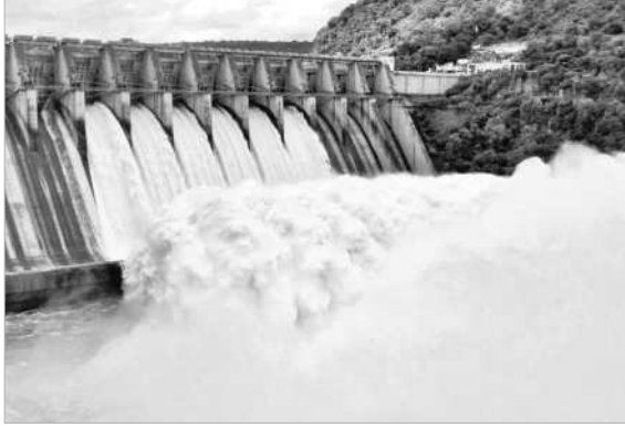
శ్రీశైలం జలాశయం ఆరు గేట్ల ద్వారా దిగువకు వరుగులు పెడుతున్న వరద

నాగర్ కర్నూల్ (నమస్తే తెలంగాణ) / అయ్యలరాజు, అక్టోబర్ 20 : శ్రీశైలం రిజర్వాయర్ గేట్లు మళ్లీ తెరుచుకున్నాయి. ఎగువన జూరాల నుంచి వరద భారంగా రావడంతో ఇంజనీరింగ్ అధికారులు 6 గేట్లను ఎత్తి నాగార్ కర్నూల్ వరకు విడుదల చేస్తున్నారు.