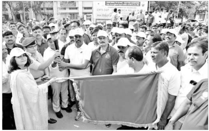
సీఎం కమిటీ సభ్యులు ప్రారంభిస్తున్న కలెక్టర్