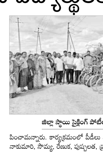
జిల్లా స్టాంపు సైకిల్ పోటీలను ప్రారంభిస్తున్న జిల్లా అధ్యక్షులు