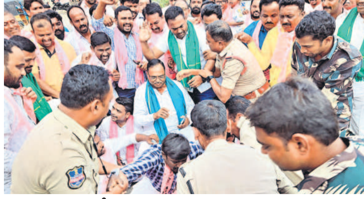
నిరసన తెలిపి.. అరెస్టులా! పెద్దపల్లిలో నిర్వహించిన ధర్నాలో పాల్గొన్న మాజీ ఎమ్మెల్యే దాసరి మనోహర్ రెడ్డిని అరెస్ట్ చేసేందుకు ప్రయత్నిస్తున్న పోలీసులు