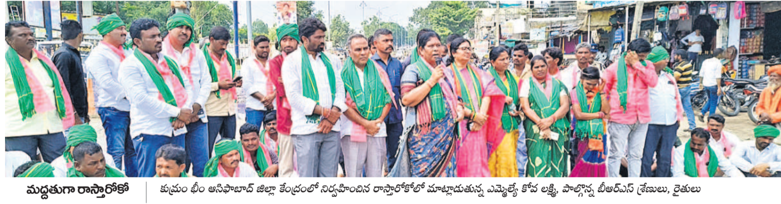
మద్దతుగా రాస్తూరోకో కుటుంబం భీం ఆసిఫాబాద్ జిల్లా కేంద్రంలో నిర్వహించిన రాస్తూరోకోలో మాట్లాడుతున్న ఎమ్మెల్యే కోవలకి, పాల్గొన్న బీఆర్‌ఎస్ శ్రేణులు, రైతులు