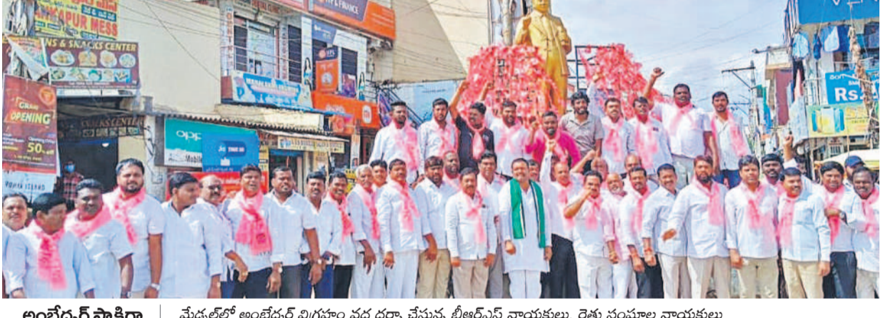
అంబేద్కర్ సాక్షిగా.. మేడ్చల్‌లో అంబేద్కర్ విగ్రహం వద్ద ధర్నా చేస్తున్న బీఆర్‌ఎస్ నాయకులు, రైతు సంఘాల నాయకులు