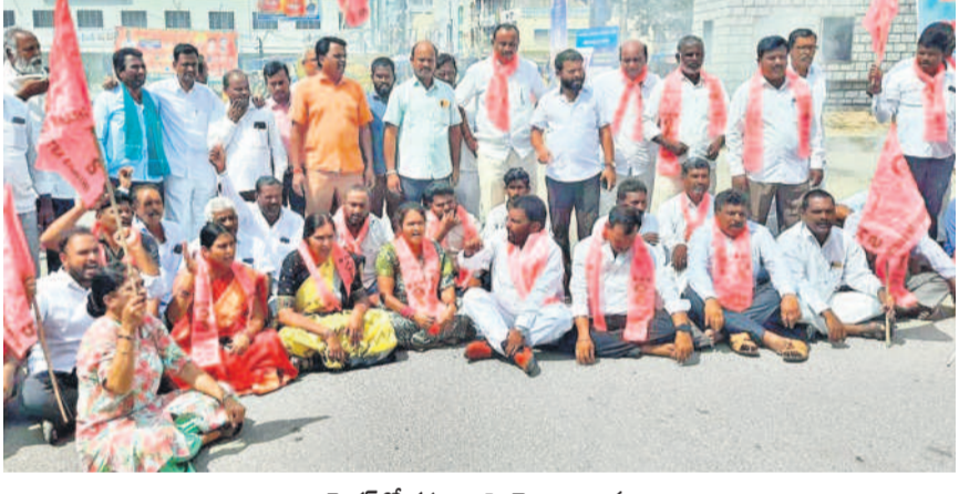
అన్నదాతలకు అండగా.. మెదక్‌లో రహదారిపై బైరాయింబిన మాజీ ఎమ్మెల్యే వర్యాదేవేందర్ రెడ్డి, బీఆర్‌ఎస్ శ్రేణులు