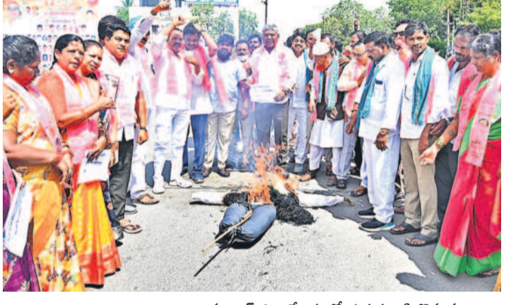
కాంగ్రెస్ పై కన్నెర్ర.. నిజామాబాద్ జిల్లా కేంద్రంలో ప్రభుత్వ దిష్టిబొమ్మను దహనం చేస్తున్న బీఆర్‌ఎస్ నాయకులు