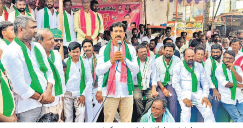
ఇక పోరుబాటే.. నారాయణపేట జిల్లా మద్దూరులో మాట్లాడుతున్న మాజీ ఎమ్మెల్యే పట్నం సరేందర్ రెడ్డి