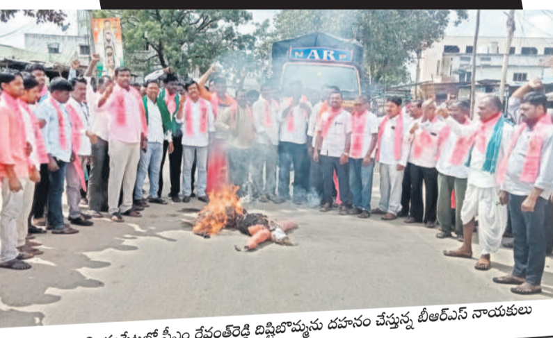
లింగంపేటలో సీఎం రేవంత్ రెడ్డి దిష్టిబొమ్మను దహనం చేస్తున్న బీఆర్ఎస్ నాయకులు