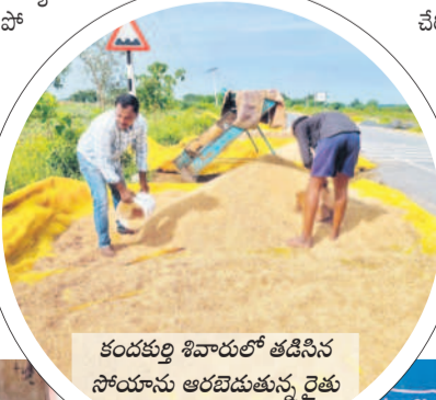
కందకర్పి శివారులో తడిసిన సోయాను ఆరబెడుతున్న రైతు

సమస్త తెలంగాణ యంత్రాంగం, అక్టోబర్ 20: ఉమ్మడి నిజామాబాద్ జిల్లాలో శని వారం రాత్రి, ఆదివారం భారీ వర్షం కురిసింది. దీంతో పలు మండలాల్లో పంటలు దెబ్బతిన్నాయి.. ఆరబె డిష్టిన దాన్వం తడిసిపో నాంది. దీంతో రైతులు అందోళన చెందుతున్నారు. కామారెడ్డి జిల్లా లింగంపేట మండలం నల్లమడుగు, బాజాపల్లి, కోల్కోల్, బాయంపల్లి, లింగంపల్లి, ఐలా దిబ్బలిగన.. ఆరబె డిష్టిన దాన్వం తడిసిపో లాల్లో భారీ వర్షం కురిసింది. సాలూరా మండలంలోని హుస్సానా, ఫత్తేపూర్, ఖాజాపూర్ గ్రామాల్లో వరి, సోయాబీన్ కుప్పలు తడిసి ముద్దయ్యాయి. భీమగల్ కేంద్రంలో ఆరబెట్టిన దాన్వం కుప్పల్లోకి వర్షపునీరు చేరింది. రెంజల్ మండలంలోని కందకర్పి, బోద్దాం, నీలా, తాడబిల్లో గ్రామాల్లో రైతులు సాగు చేసి చేతికొచ్చిన సోయా పంట తడిసిపోయింది. ఉమ్మడి కోటగిరి మండలంలో రైతులు ఆరబెట్టిన దాన్వంలోకి వర్షపునీరు చేరింది. సవీపేట మండలంలోని రాంపూర్, రెడ్డిపాల్ మోకనపల్లి, నాశిశర్ తదితర గ్రామాల్లో చేతికి వచ్చిన దాన్వం తడిసిపోయింది. తడిసిన వరి దాన్వం ఆరబెట్టడం రైతులు తీవ్ర ఇబ్బందులు ఎదుర్కొంటున్నారు.