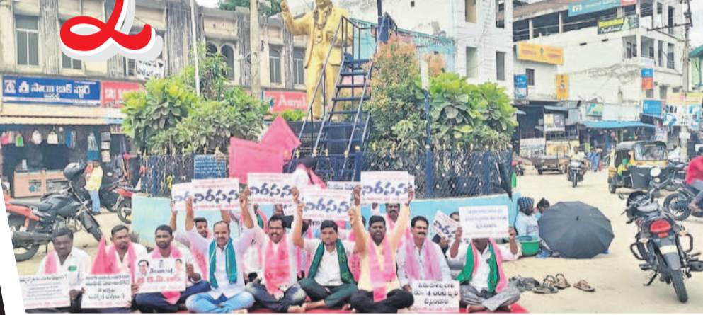
బాన్సువాడలోని అంబేద్కర్ చౌరస్తా వద్ద బీఆర్ఎస్ నాయకుల నిరసన దీక్ష