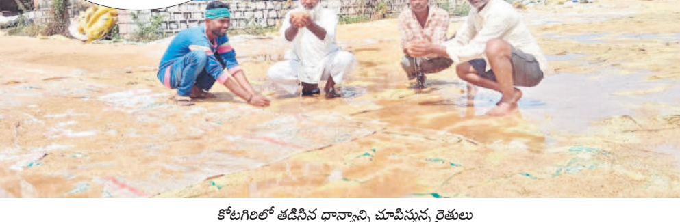
కోటగిరిలో తడిసిన దాన్వం మామిషున్న రైతులు