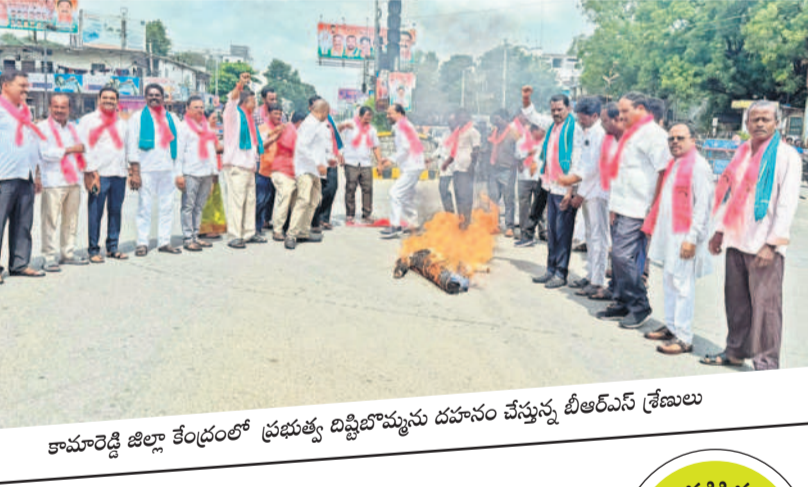
కామారెడ్డి జిల్లా కేంద్రంలో ప్రభుత్వ దిష్టిబొమ్మను దహనం చేస్తున్న బీఆర్ఎస్ శ్రేణులు