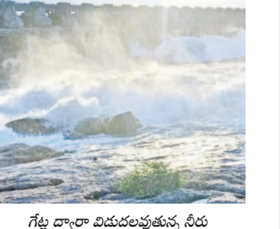
గేట్ల ద్వారా విడుదలవుతున్న నీరు

మార్కెడ్, అక్టోబర్ 20: శ్రీరాంసాగర్ ప్రాజెక్ట్ లోకి ఆదివారం వరద ఉధృతి పెరిగింది. దీంతో అధికారులు 12 గేట్ల ఎత్తి మిగులు జలాలును గోదావరి లోకి విడుదల చేస్తున్నారు. ఆదివారం ప్రాజెక్ట్ లోకి 46,942 క్యూసెక్కుల వరద వచ్చింది. ప్రాజెక్ట్ పూర్తిస్థాయి నీటిపట్టం 1091 అడుగులు (80.5 మీటర్లు) కాగా, ప్రాజెక్ట్ లో ప్రస్తుతం 1091 అడుగులు (80.5 మీటర్లు) నీటిని ఉన్నది. ప్రాజెక్ట్ నుంచి 12 గేట్ల ఎత్తి 37,488 క్యూసెక్కుల నీటిని గోదావరిలోకి వదులుతున్నారు. కాకతీయ కాలువకు 5800, ఎస్సీగేట్ల ద్వారా 2200, లక్ష్మీకాలువకు 150, వరదకాలువకు ఐదు వేలు, సరస్వతీ కాలువకు 500 క్యూసెక్కుల నీటిని విడుదల చేస్తున్నారు.