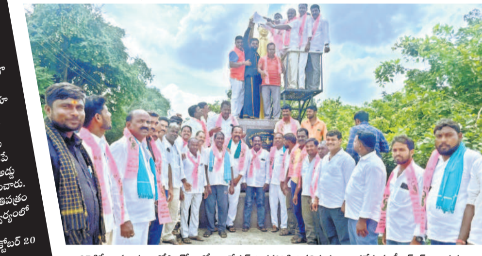
నాగిరెడ్డిపేట మండలం గోపాలపేటలో అంబేద్కర్ విగ్రహానికి వినతిపత్రం అందజేస్తున్న బీఆర్ఎస్ నాయకులు