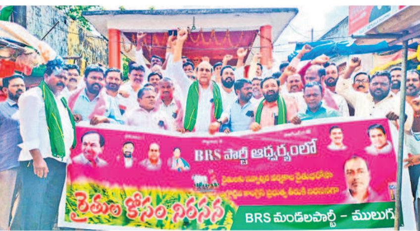
ములుగులోని గాంధీవోల్ వద్ద నల్లబ్యాడ్జిలు ధరించి రైతులకు మద్దతుగా నివాదాలు చేస్తున్న బీఆర్ఎస్ నాయకులు