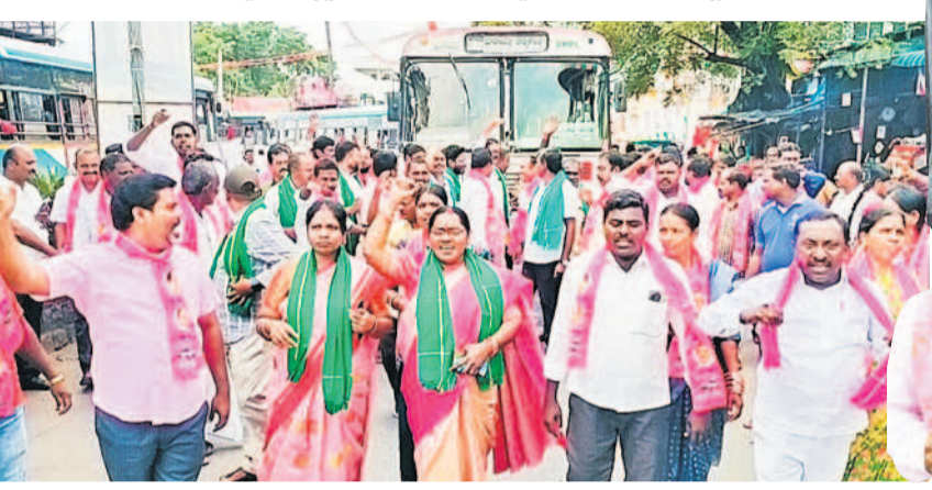
పరకాలలో కాంగ్రెస్ ప్రభుత్వ వైఖరిపై నిరసన వ్యక్తం చేస్తున్న బీఆర్ఎస్ నాయకులు