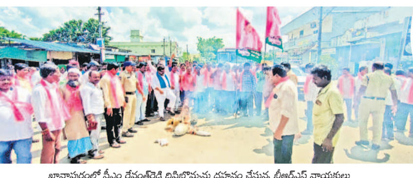
ఖానాపూర్లో సీఎం రేవంత్ రెడ్డి దిష్టిబొమ్మను దహనం చేస్తున్న బీఆర్ఎస్ నాయకులు