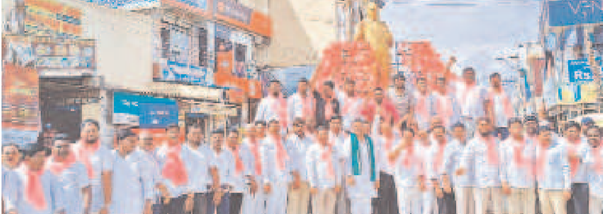
అంటే ధర్మ సాక్షిగా.. మేడ్చల్లో అంటే ధర్మ విగ్రహం వద్ద ధర్మా చేస్తున్న బీఆర్ఎస్ నాయకులు, రైతు సంఘాల నాయకులు