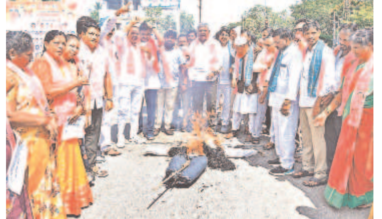
కాంగ్రెస్ పై కన్నెత్త.. నిజామాబాద్ జిల్లా కేంద్రంలో ప్రభుత్వ దిష్టిబొమ్మను దహనం చేస్తున్న బీఆర్ఎస్ నాయకులు