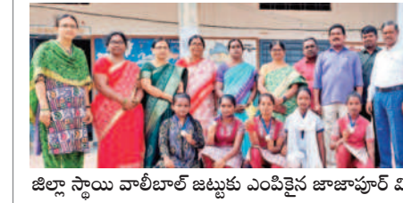
జిల్లా స్థాయి వాలీబాల్ జట్టుకు ఎంపికైన జాబాహుర్ విద్యార్థులు

నారాయణపేట రూరల్, అక్టోబర్ 18 : పేట మినీస్టేట్ యంత్రం 68వ ఎన్ జీఎం అండర్-17 మండల స్థాయి వాలీబాల్ పోటీలు, సెలక్షన్ గురువారం జరిగాయి. ఇందులో పేట మండలంలోని జాబాహుర్ ఉన్నత పాఠశాల