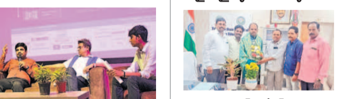
ఎంటర్ ప్రెన్యూర్లపై విద్యార్థులకు అవగాహన కల్పిస్తున్న వివిధ కంపెనీల ప్రతినిధులు