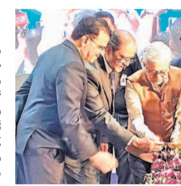
సదస్సును ప్రారంభిస్తున్న గవర్నర్ జిష్టుదేవ్ వర్మ, ఓటోలంగాల జిల్లా సాంకేతిక ప్రతినిధులు

శామీరపేట, అక్టోబర్ 18 : ప్రజలకు మెరుగైన వైద్య సేవలందించే ఆవిష్కరణలు చేయాలి అని గవర్నర్ జిష్టుదేవ్ వర్మ అన్నారు.