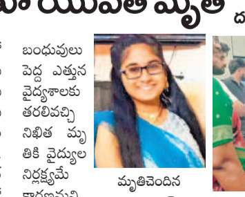
మ్యుచివెలిన నిఖిత ప్రైవేట్ కారణమని పేర్కొంటూ మృతుల బంధువులు

చర్లపల్లి, అక్టోబర్ 18 : వైద్యుల నిర్లక్ష్యంతో యువతి మృతి చెందింది.