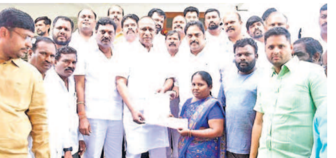
ఘట్టేశ్వర్ క్యాంపు కార్యాలయంలో బీఆర్ఎస్ కార్యకర్త కుటుంబానికి దా. 2 లక్షల పాత్ర జీవిత బీమా చెక్కును అందజేస్తున్న ఎమ్మెల్యే చామకూర మల్లారెడ్డి

ఘట్టేశ్వర్, అక్టోబర్ 18 : కార్యకర్తలకు బీఆర్ఎస్ పార్టీ ఎల్లప్పుడూ అండగా ఉంటుందిని ఎమ్మెల్యే చామకూర మల్లారెడ్డి అన్నారు.