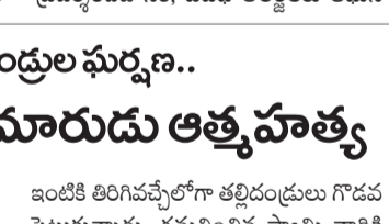
ఇంటికి తిరిగివచ్చేలోగా తల్లిదండ్రులు గొడవ పెట్టుకున్నారు. గమనించిన స్వామి వారికి ఎంజాతో, తుంకులంబ జడ్జి హామ్స్ ప్రధానోపాధ్యాయులు అనుమతిని తెలిపారు.

జవహర్ నగర్, అక్టోబర్ 18 : నిత్యం తల్లిదండ్రుల ఘర్షణ పడుతుండటంతో మనస్తాపంతో కుమారుడు ఆత్మహత్య చేసుకున్నాడు.