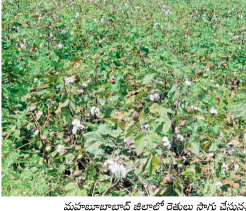
మహబూబాబాద్ జిల్లాలో రైతులు సాగు చేస్తున్న పత్తి పంట

పత్తి రైతు దగా ప్రతికూల పరిస్థితులతో పెరిగిన పెట్టుబడి భారం