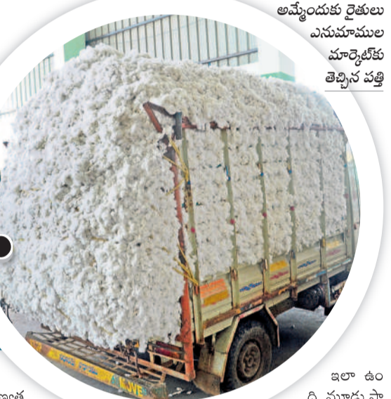
అమ్మోందుకు రైతులు ఎనుమాముల మార్కెట్లో తెచ్చిన పత్తి

ఈసారి పత్తి రైతు పరిస్థితి దయనియంగా మారింది. ఓ వైపు ప్రతికూల పరిస్థితులతో పూత, కాతపై ప్రభావం చూపి ఆశించిన దిగుబడి రాకపోగా మరోవైపు చేతికొచ్చిన అరకొర పంటకు 'మద్దతు' కరువుంది. భారీ వర్షాలతో ఇప్పటికే నష్టపోయి కుంగిపోతున్న రైతులను పెట్టుబడి భారం పెరగడం మరింత కలవరపడుతున్నది. దీనికి తోడు సీసీబి కొనుగోలు కేంద్రాలు ప్రారంభించకపోగా ప్రైవేట్లో మాత్రం కొనుగోళ్లు జీరందంకూడా. అలాగే వ్యాపారుల మాయాజాలంతో అక్కడా రైతుకు నష్టమే కలుగుతున్నది. అటు వరంగల్లోని ఎనుమాముల మార్కెట్లోనూ కొనుగోళ్లు మొదలైనప్పటి నుంచి ఇప్పటివరకు బి ఒక్క రోజు కూడా ప్రభుత్వ మద్దతు ధర దక్కకపోవడంతో నిరాశ మిగులు తున్నది. గురువారం క్వింటా పత్తికి రూ. 7,010 ఉండగా రోజురోజుకూ తగ్గుతూనే ఉంది. దీనికి తోడు మార్కెట్లో కనీస వసతులు లేక రైతులు ఇబ్బందులు పడుతున్నా అధికారుల పర్యవేక్షణ లోపం నష్టంగా కనిపిస్తున్నది. - వరంగల్, మహబూబాబాద్, జయశంకర్ భూపాలవల్లి, జనగామ, అక్టోబర్ 17(నమస్తే తెలంగాణ)/కేసముద్రి