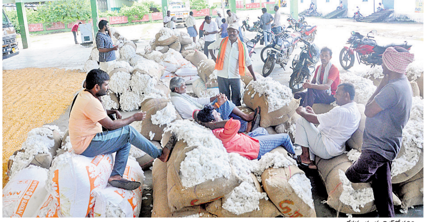
తేమమధ్యం మార్కెట్లో పత్తిని విక్రయించేందుకు బిల్వాలపై కూర్చోని వ్యాపారుల కోసం ఎదురు చూస్తున్న రైతులు