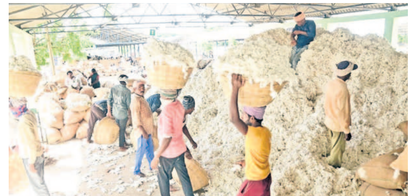
మార్కెట్లో కొనుగోలుకున్న క్రయవిక్రయాలు