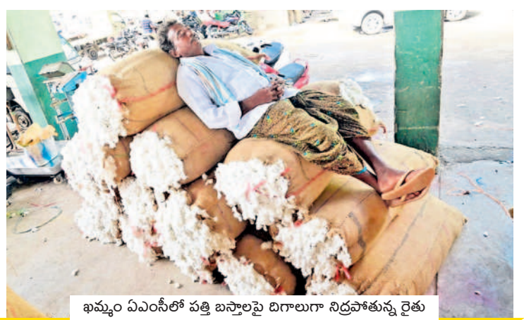
ఖమ్మం ఏఎస్ఐలో పత్తి బస్తాలపై దిగాలుగా నిద్రపోతున్న రైతు

ఆరుగాలు కష్టించి, పత్తి పైవరత్యాలను ఎదిరించి తీరా వంట చేతికొచ్చేసరికి పత్తి రైతు చతికిపడడం సర్వ సాధారణమైంది. గతేడాది అనావృష్టి కారణంగా పెద్దగా సాగు చేపట్టిన ఖమ్మం జిల్లా రైతులు ఈ ఏడాది కోటి ఆకలతో పత్తిని లభిక విస్తీర్ణంలో సాగు చేశారు. అయితే తాము ఒకటి తరిస్తే.. దైవం మరొకటి తరిచింది అన్నట్లు తయారైంది పరిస్థితి. ఒకవైపు పత్తి పైవరత్యాలు, మరో వైపు ప్రభుత్వం నుంచి సాయం అందక పోవడంతో అన్నదాతలను కష్టాలు వెంటాడుతున్నాయి. పత్తి సాగుకు ఖమ్మం జిల్లా పెట్టింది పేరు.. సార వంతమైన భూములు, అనుభవం కలిగిన రైతులు ఉన్నప్పటికీ కొన్నేండ్లుగా ఆశించిన ఫలితాలు పొందలేకపోతున్నారు. జిల్లాలో ఏటా దాదాపు 2 లక్షల ఎకరాలకు పైబడి పత్తి సాగు చేస్తున్న రైతులు ఈ ఏడాది సైతం ఒకవైపు దిగు బడి లేక.. మరొకవైపు గిట్టు బాటు ధర రాక దిగాలు చెందుతున్నారు.