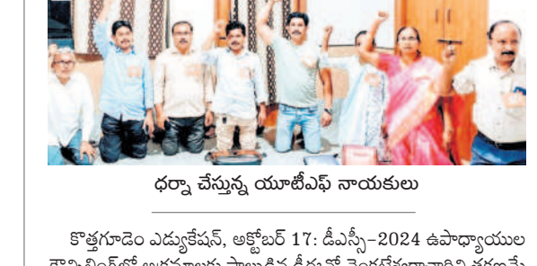
ధర్నా చేస్తున్న యాటీపీవీ నాయకులు