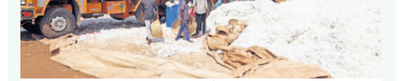
దళారులు కొనుగోలు చేస్తున్న పత్తి (ఫైర్)

భద్రాద్రి కొత్తగూడెం, అక్టోబర్ 17 (నమస్తే తెలంగాణ) : పత్తి రైతులకు కష్టాలు వచ్చినప్పటికీ జిల్లాలో వానల దంపికొట్టడం.. మరో వైపు తెగుళ్లు ఆశించడంతో పత్తి దిగుబడి తగ్గకున్నదని భద్రాద్రి కొత్తగూడెం జిల్లా రైతులు ఆందోళన చెందుతున్నారు. దీనికి తోడు దళారుల బెడద ప్రతి ఏటా వెంటాడుతున్నాయి. దసరా తర్వాత కొనుగోలు కేంద్రాలు ఏర్పాటు చేస్తామన్న సీసీవ నేటికీ కేంద్రాలను ప్రారంభించలేదు. ఏటా లక్షల మెట్రిక్ టన్నులు పత్తి దిగుబడి అవుతుండగా.. అందులో కేవలం సీసీవ ప్రతి ఏటా 5 నుంచి 6 లక్షల మెట్రిక్ టన్నుల వరకు మాత్రమే కొనుగోలు చేస్తామన్న వస్తుంది. దీంతో పత్తి పంట దళారులపాలపుతున్నది.