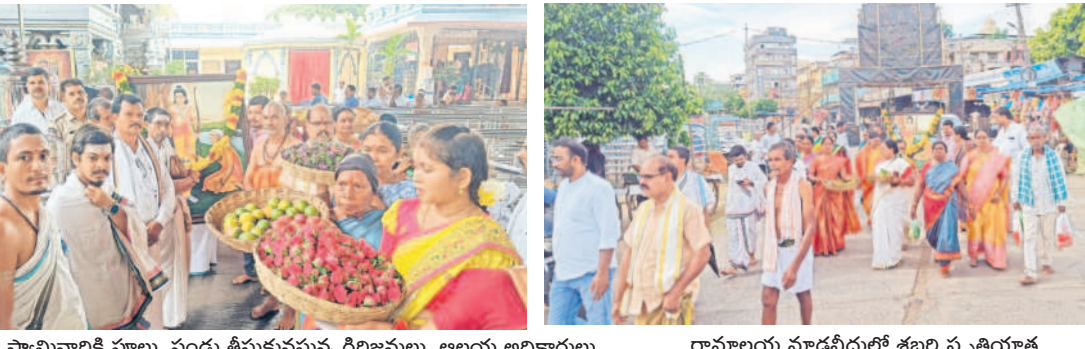
స్వామివారికి పూలు, పండ్లు తీసుకువస్తున్న గిరిజనులు. అలయ అధికారులు రామాలయ మాడవీధుల్లో శబరి స్మృతీయాత్ర