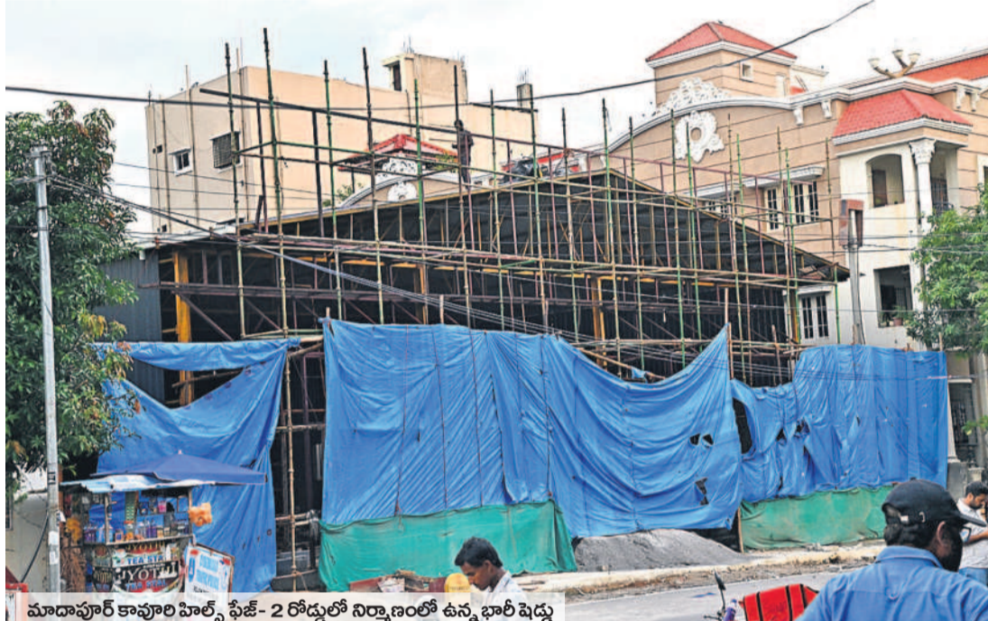
మాదాపూర్ కాపురా హిల్స్ ఫేజ్-2 రోడ్డులో నిర్మాణంలో ఉన్న భారీ షెడ్యూల్