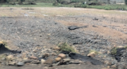
వరి పాలంలో రాళ్లు మేటలు (ఫైల్)

అతీరు వరద ప్రవాహానికి 50 కుటుంబాలకు చెందిన 300 ఎకరాల్లో పంటలు కొట్టుకుపోయాయి. వ్యవసాయ భూములు రాళ్ల కుప్పలుగా, ఇసుక మేటలుగా మారాయి. పచ్చని పంటలు పండి భూములు సాగు చేయడానికి పనికి రాకుండా పోయాయి. అట్టి భూములు మళ్లీ సాగు చేసుకునే విధంగా తయారు చేసుకోవాలంటే ఎకరం ఒక్కంటికి రూ. అక్షకు పైసానే ఖర్చు చేయాలిని పరిస్థితి నెలకొంది. అయినా ప్రభుత్వం పైసా సాయం కూడా అందించలేదు. దీంతో చేసేదేమీలేక రైతులు కూలిలుగా మారి బతుకు దెరుపు కోసం ఇతర ప్రాంతాలకు వలస బాట పడుతున్నారు.