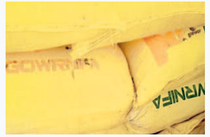
రాకాశితండాలో తడిచిన ధాన్యం బస్తాలు

రాకాశితండాలో 77 కుటుంబాలకు గాను 66 కుటుంబాల వారికి ప్రభుత్వం రూ. 16,500 చొప్పున వారి ఆకొంట్లలో జమ చేశారు. మిగిలిన కుటుంబాల వారికి ఒక్కపైసా రాలేదు. దాతలు అందించిన ఆర్థిక సాయం తప్ప ప్రభుత్వం తమకు ఏమీ సాయం చేయలేదని గ్రామస్థులు ఆవేదన చెందుతున్నారు. నష్టపోయిన పంటలకూ పైసా ఇవ్వలేదని, కూలిపోయిన ఇళ్లు, కొట్టుకుపోయిన సామాజ్ఞకు పరిహారం చిట్టిగవ్వ అందలేదని చెబుతున్నారు.