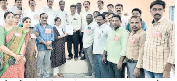
కొత్తగా చేరిన టీచర్లతో అధ్యక్ష ఎంపికలో రాములు, ఉపాధ్యాయ సంఘాల నేతలు

రింగ్లంపావడంతో ఉన్నతాధికారుల ఆదేశాల మేరకు పోస్టింగ్ లు ఇస్తులేదు. తొలిరోజు 481 మంది రిపోర్ట్.. జిల్లాలో 516 మందికి ఉపాధ్యాయులుగా నియామక ఉత్తర్వులు అందించగా.. వారిలో 481 మంది తమకు కేటాయించిన పాఠశాలల్లో హాచ్ ఎంపిలకు బుధవారం రిపోర్ట్ చేశారు. కొత్తగా విద్యుత్ చేరేందుకు వచ్చిన టీచర్లనుంచి నియామక ఉత్తర్వులతోపాటు జాయింట్ రిపోర్ట్ ను తీసుకుని రిజిస్ట్రేషన్లో పేరు నమోదు చేశారు. దీంతో అన్ని పాఠశాలల్లో కొత్త ఉపాధ్యాయుల రాకతో కోలాహలం నెలకొంది. సూతనంగా బాధ్యతలు స్వీకరించిన టీచర్ల స్వీట్లు అందజేయగా.. మిగిలిన ఉపాధ్యాయులు వారికి అభినందనలు తెలిపారు. 85 మంది ఉపాధ్యాయులు ఇంకా రిపోర్ట్ చేయట్లే ఉంది. పాఠశాలల్లో రిపోర్ట్ చేసినందుకు ప్రభుత్వం 15 రోజుల వరకు ఇచ్చిన విషయం తెలిసింది. అయితే చాలా మందికి మాత్రమే సూతనంగా బాధ్యతలు స్వీకరించిన టీచర్లు అక్కడికి ఎంపికయ్యారని తెలిపారు. అత్యధికంగా ఖమ్మం అర్బన్ మండలంలో 44 మంది ఉపాధ్యాయులు బాధ్యతలు స్వీకరించినట్లు ఎంపికలో రాములు తెలిపారు. రిపోర్ట్ లో ప్రక్రియను డి.ఈ.ఎం. సోమేశ్వర శర్మ ఎప్పటికప్పుడు పర్యవేక్షించారు. డి.పి.సీ.ఎం. 2024 ద్వారా కొత్త టీచర్ల రావడంతో అంతకుముందున్న డి.పి.సీ.ఎం. బదిలీ ఉపాధ్యాయులను రిలీవ్ చేశారు.