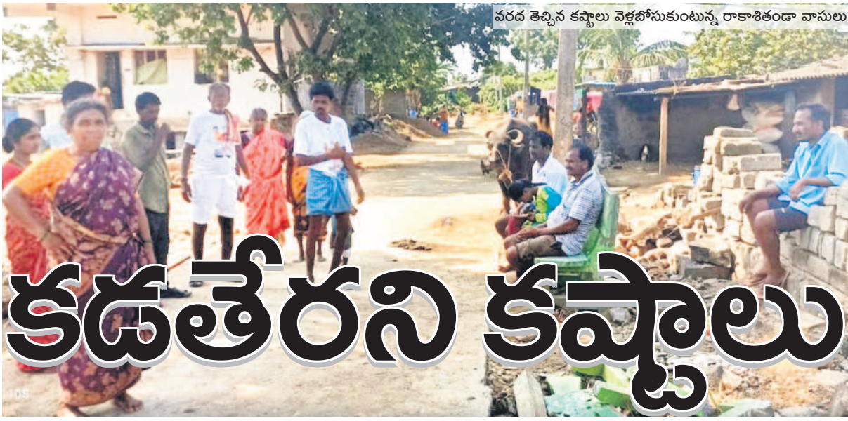
వరద తెచ్చిన కష్టాలు వెళ్లబోతున్న రాకాశితండా వాసులు