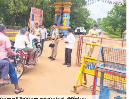
దామగుండం దానికి వెళ్ళేటప్పుడు అడ్డుకుంటున్న పోలీసులు