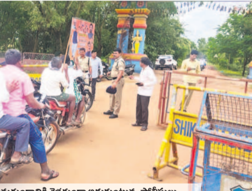
దామగుండం నికే వెళ్లకుండా అడ్డుకుంటున్న పోలీసులు

బీఆర్ఎస్ నేతలు, దామగుండం పరిరక్షణ జేపీసీ నేతలను ఎక్కడికక్కడ అరెస్టు చేసిన పోలీసులు