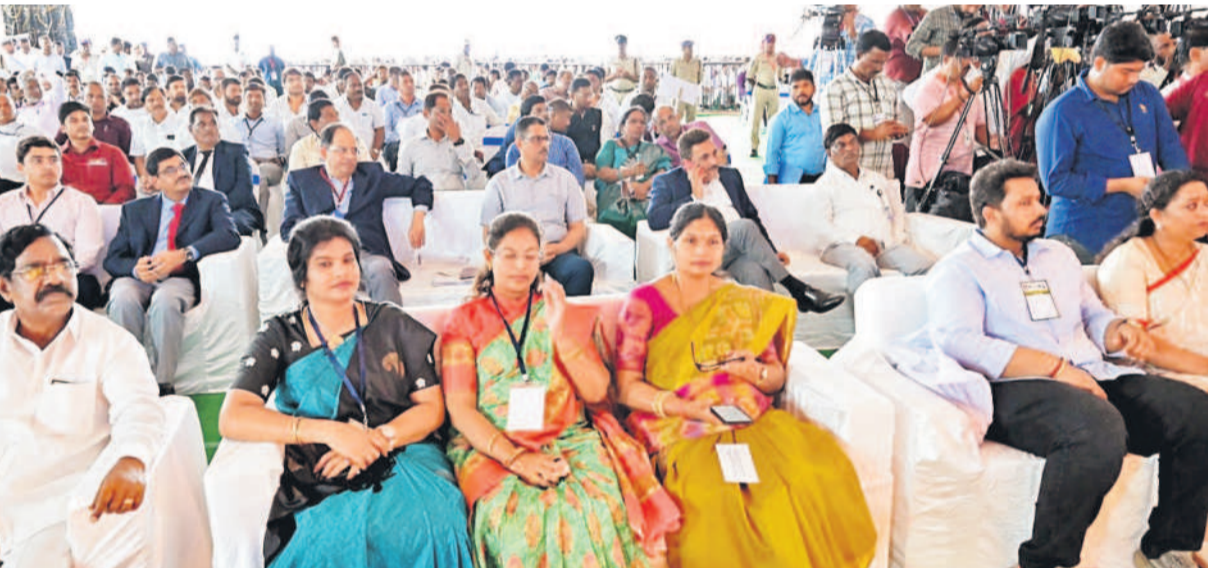
శంకుస్థాపన కార్యక్రమంలో పాల్గొన్న ప్రజాప్రతినిధులు, అధికారులు