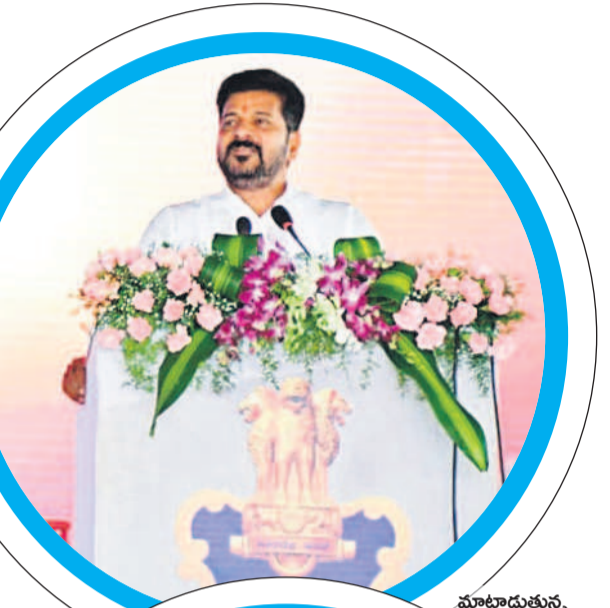
మాట్లాడుతున్న సీఎం రేపంత్ రెడ్డి