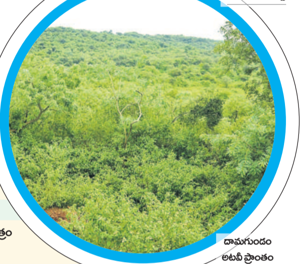
దామగుండం అటవీ ప్రాంతం