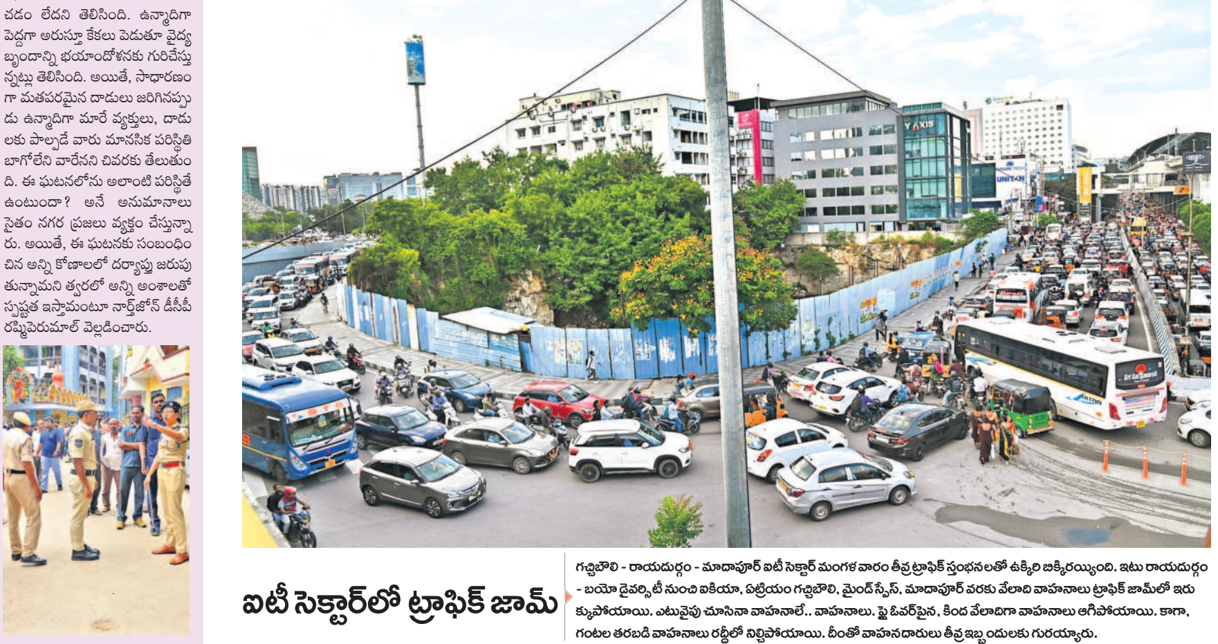
గడ్డిపాలి - రాయదుర్గం - మాదాపూర్ బట్టి సెక్టార్ మంగళవారం తీవ్ర ట్రాఫిక్ సందంభంతో ఉక్కిరిబిక్కిరిస్తుంది. ఇటు రాయదుర్గం - బయ్యారా రైల్వేలోని సుందరియా, ఏల్లెంపల్ గడ్డిపాలి, మైదీసీసీ, మాదాపూర్ వరకు వెలది వాహనాలు ట్రాఫిక్ జామ్లో ఇరుక్కుపోయాయి. ఎటువైపు చూసినా వాహనాలే.. వాహనాలు, టైలర్లపై, కిరం వేలాదిగా వాహనాలు ఆగిపోయాయి. కాగా, గంటల తరబడి వాహనాల రద్దీలో నిల్చిపోయాయి. రింజీ వాహనాలకు తీవ్ర ఇబ్బందులు గురయ్యాయి.

సీటీబ్యూరో, అక్టోబర్ 15 (నమస్తే తెలంగాణ): ప్రభుత్వ కొత్త ఉపాధ్యాయులైన 584 మందికి హైదరాబాద్ జిల్లాలో పోస్టింగులు లభించాయి. అభ్యర్థులకు మంగళవారం కొన్ని లింగ్ ప్రక్రియ ద్వారా విద్యాశాఖ పోస్టింగులు కేటాయించింది. జిల్లాలో 878 పోస్టులకు గాను కొద్ది కేసులు, రిజర్వేషన్ కేటగిరీలో అభ్యర్థుల కొరత, ఇన్ సర్వీస్ తదితర కారణాలతో సుమారు 262 మంది పోస్టులకు అభ్యర్థుల ఎంపిక పెండింగులో పడింది. మిగతా 6161 పోస్టులలో అభ్యర్థులను ఎంపిక చేసినప్పటికీ డ్రువీకరణ పత్రాలు రి వెరిఫికేషన్తో 32 మంది అభ్యర్థులకు నియామక పత్రాలు నిలిపివేశారు. మంగళవారం 585 మంది అభ్యర్థులు మాత్రమే నియామక పత్రాలను అందుకున్నారు. ఇందులో 386 ఎస్సీ, 107 ఎస్ఎం, 91 ఎల్ఐ అభ్యర్థులకు పోస్టింగులు లభించాయి.