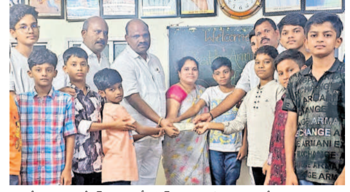
అర్కేపురం, అక్టోబర్ 14: ఎల్సీనగర్ విద్యార్థులకు విరాళం