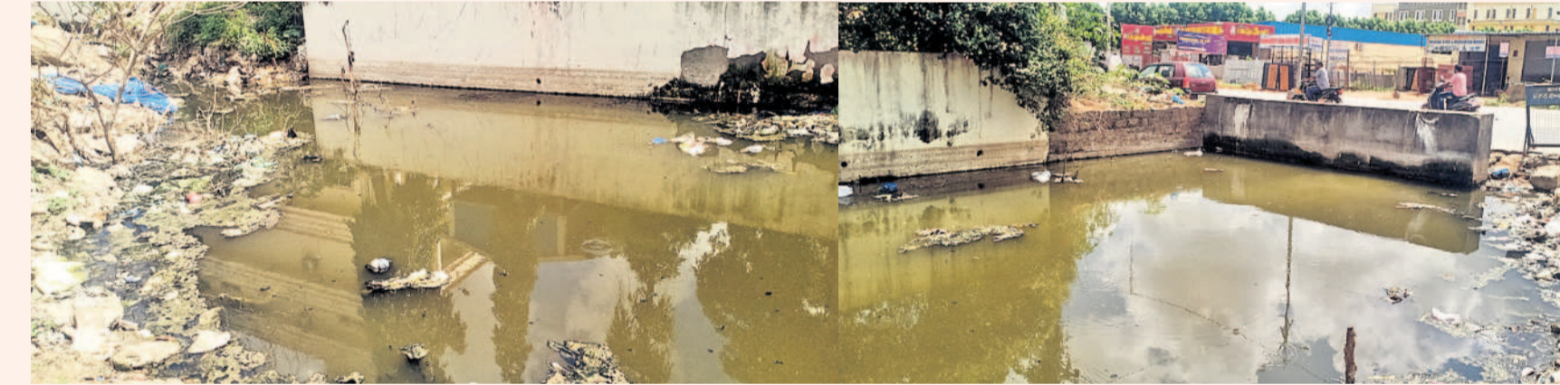
బదంగపేట ప్రధాన రహదారి పక్కన మురికి కూపంగా మారిన దృశ్యాలు

అందోళన వ్యక్తం చేస్తున్నారు. రంగారెడ్డి జిల్లా కలెక్టర్ కార్యాలయానికి, విమానాశ్రయానికి నిత్యం వేలాది వాహనాలు ప్రయాణించే రహదారి మురికి